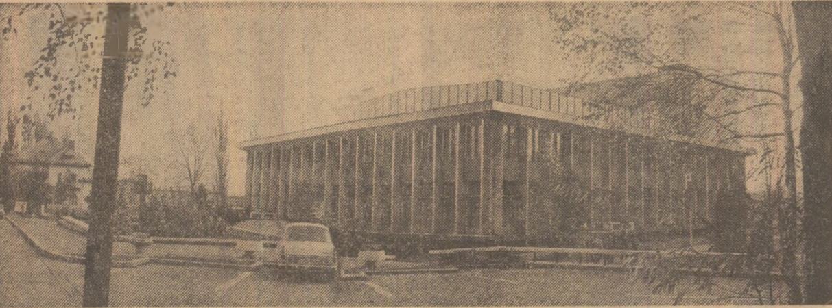
Casa de cultură din Petroșani — unul din edificiile „de emblema” ale Văii Jiului de azi