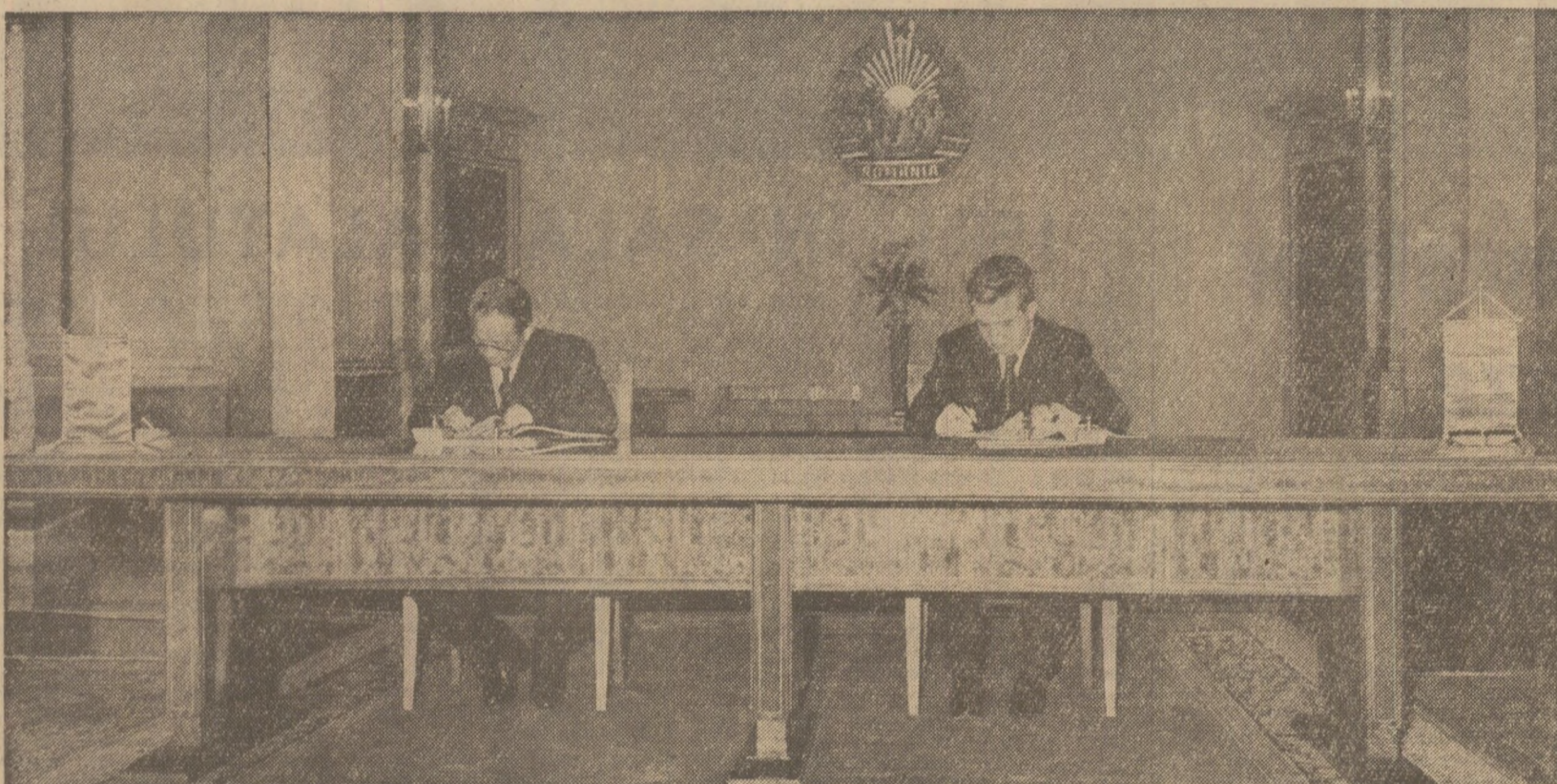
Solemnitatea semnării Declarației comune româno-vietnameze