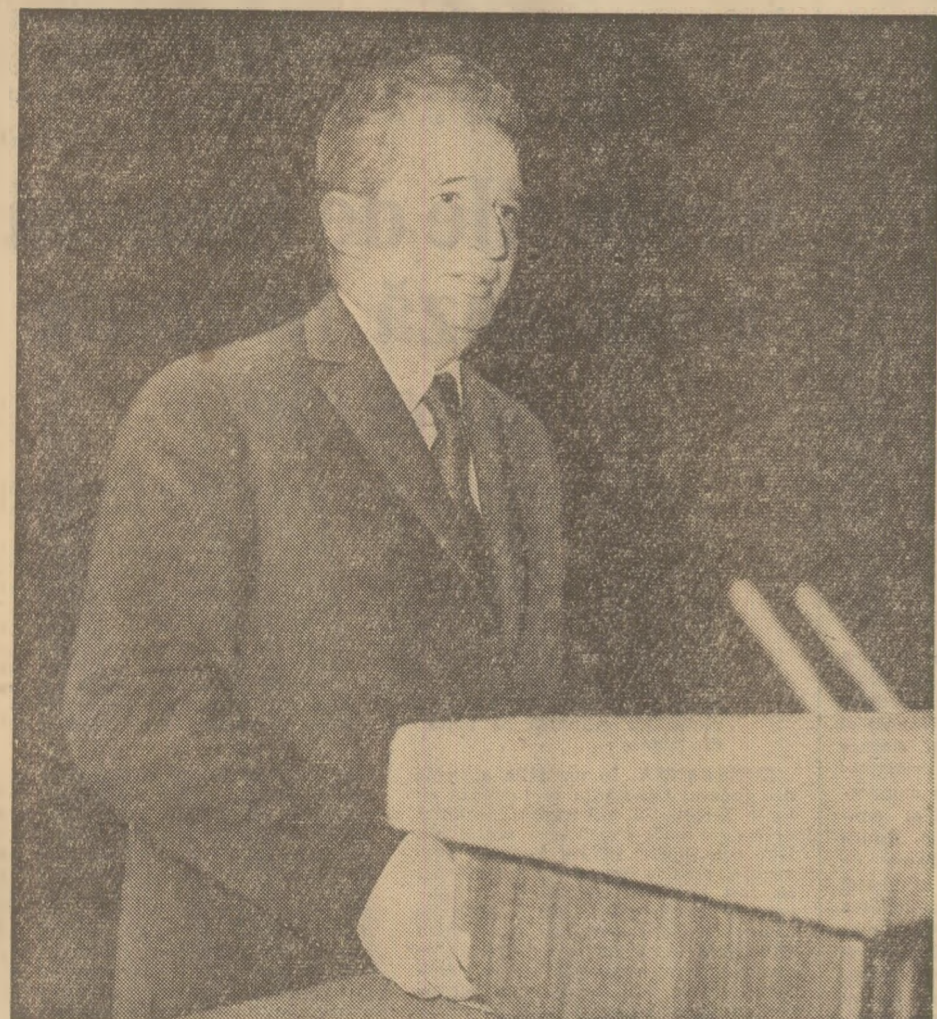
(Urmare din pag. 1)

capitoli etnici și echitățile socialiste, pentru formarea omului înaintat — constructor al noul orizont.