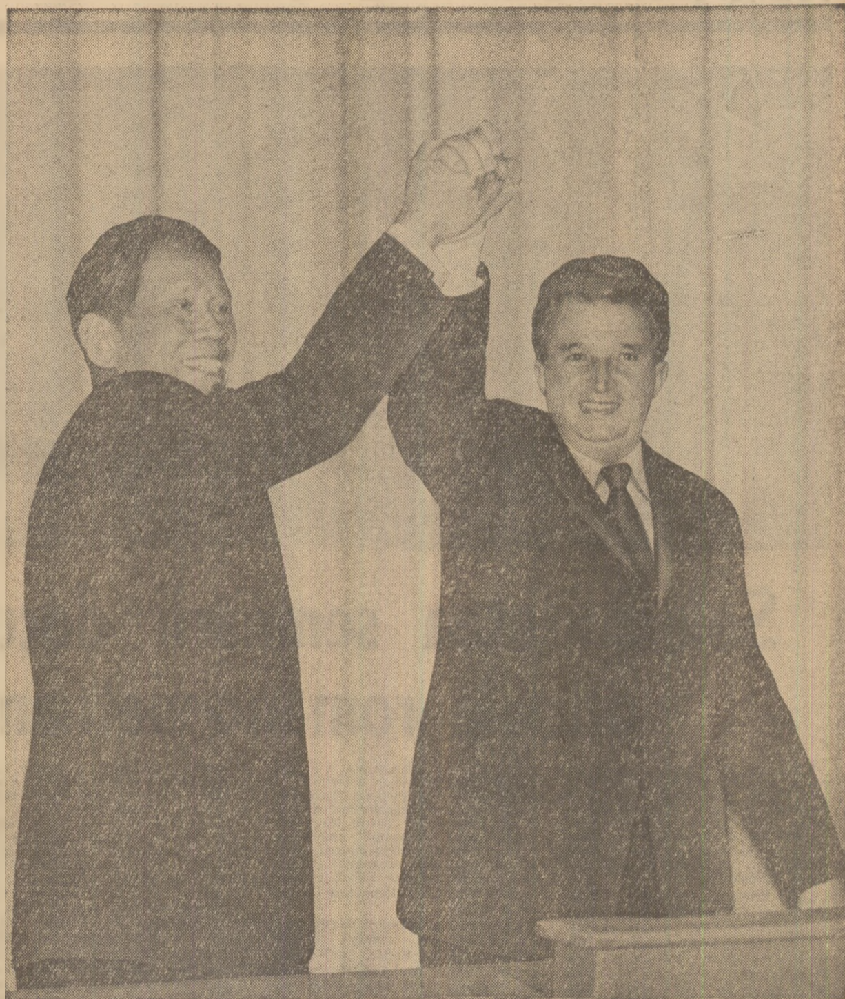
Moment din timpul grandiosului miting al prieteniei româno-vietnameze