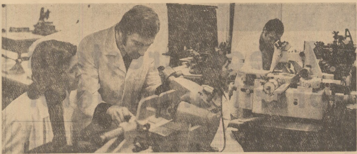
Institutul politehnic din București. Studenții din anul III (secția subinginerii) ai Facultății de tehnologia construcțiilor de mașini, efectuînd măsurătorii cu microscopie de înaltă precizie, în laboratorul de măsurători tehnice și toleranțe.

— În stare de ebrietate se poate afla orice conducător auto care, chiar cu o imbușcătoare alcoolică mai mică de 1 la mie, are manifestări caracteristice acestei stări, adică: mers nesigur, gândire incoerentă, memorie difuză, atenție slăbită și altele care se pot constata clinic sau prin alte mijloace de probă.