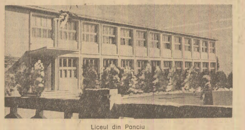
Liceul din Panciu

Ședințele plenare ale consiliilor oamenilor muncii de naționalitate maghiară și germană IN PAGINA A II-A