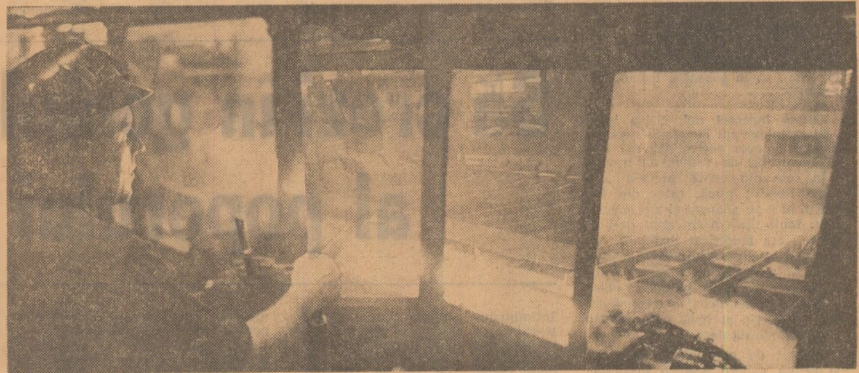
Întreprinderea de țevi „Republica” din Capitală. Secvență de muncă din sectorul laminor

La invitația președintelui Republicii Socialiste România, Nicolae Ceaușescu, și a tovarășei Elena Ceaușescu, șeful statului Cambodgia, președintele Frontului Unit Național al Cambodgiei, prințul Norodom Sianuk, împreună cu prințesa Monique Sianuk, va efectua o vizită oficială de prietenie în țara noastră în a doua decadă a lunii decembrie 1975.