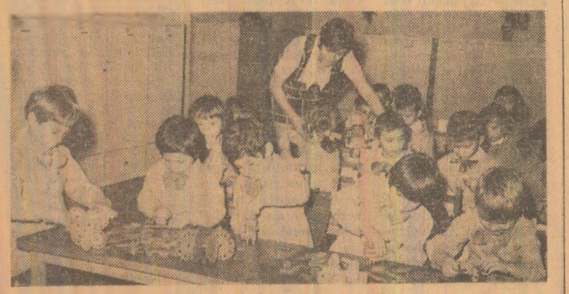
La noua grădiniță din cartierul Mărăței