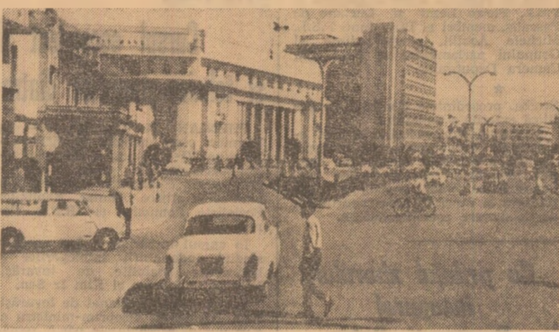
Poporul kenyan aniversează astăzi un eveniment de importanță crucială în istoria țării sale - cucerirea, în urmă cu 12 ani, a independenței naționale.

NICOLAE CEAUȘESCU Președintele Republicii Socialiste România