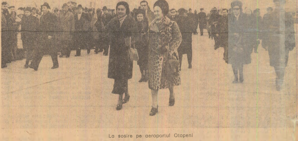
La sosire pe aeroportul Otopeni