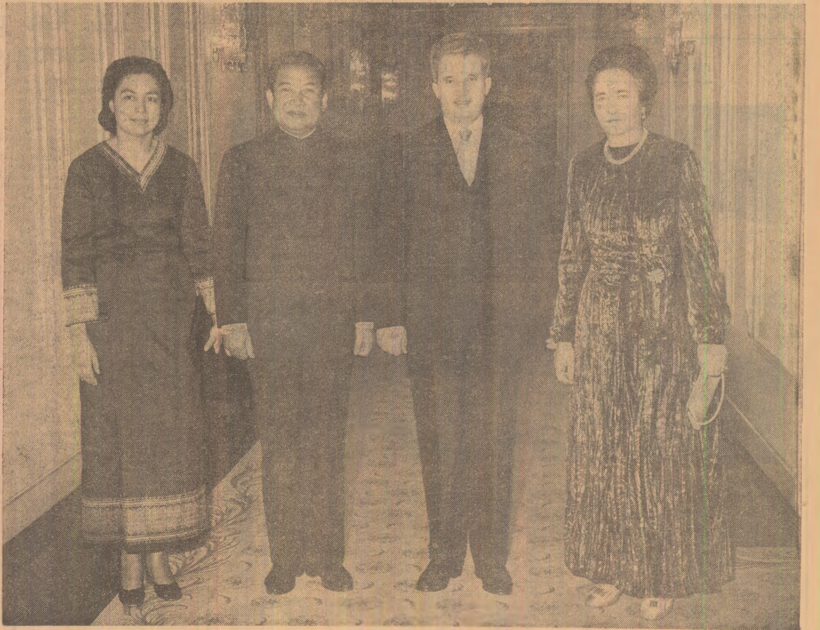
În timpul dineului oficial