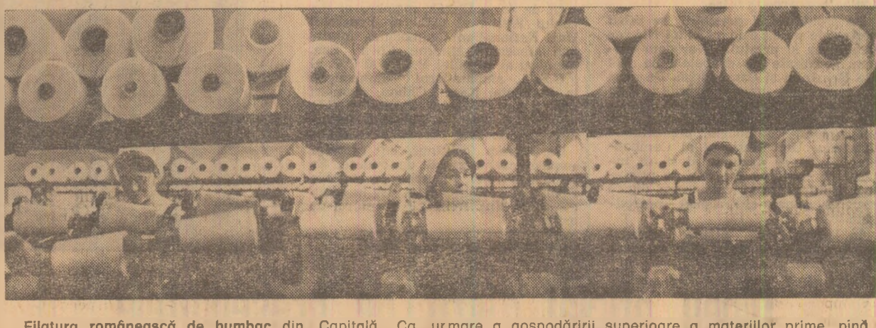
Filatura românească de bumbac din Capitală. Ca urmare a gospodăririi superioare a materiilor prime, pînă la sfîrşitul anului se vor valorifica circa 90 tone deşeurile rezultate din procesul tehnologic, din care se vor obţine 60 tone fibre pentru produse tehnice. În fotografie: aspect din secţia finisaj a întreprinderii.