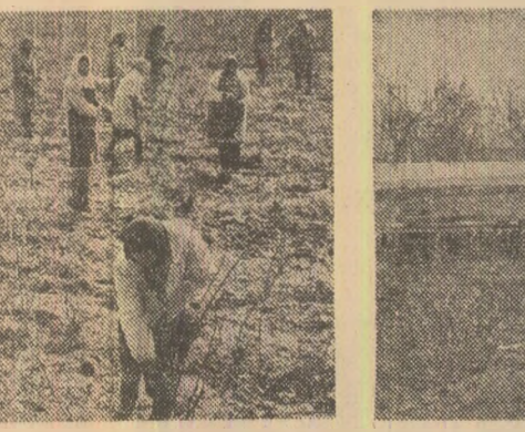
Pe ome, în vie și livazi se muncește intens, cu toate forțele. Obiectivul aparatului de fotografiat a surprins câteva evenimente semnificative pentru acest sezon (de la stînga la dreapta): tăierea vitei de vie în podgoriile cooperativei agricole din Bucov — Prahova; pregătirea terenului la cooperativa agricolă Pitulicea — Buzu și semănatul fetei de zahăr la cooperativa agricolă Movilița — Ilfov