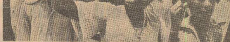
Populația din Luanda salută cu entuziasm eliberarea totală a teritoriului Republicii Populare Angola

Un violent incendiu a izbucnit în noaptea de vineri spre sîmbătă într-un hotel din Miami. Potrivit unui bilanț provizoriu, șapte persoane și-au pierdut viața și 13 au fost rănite.