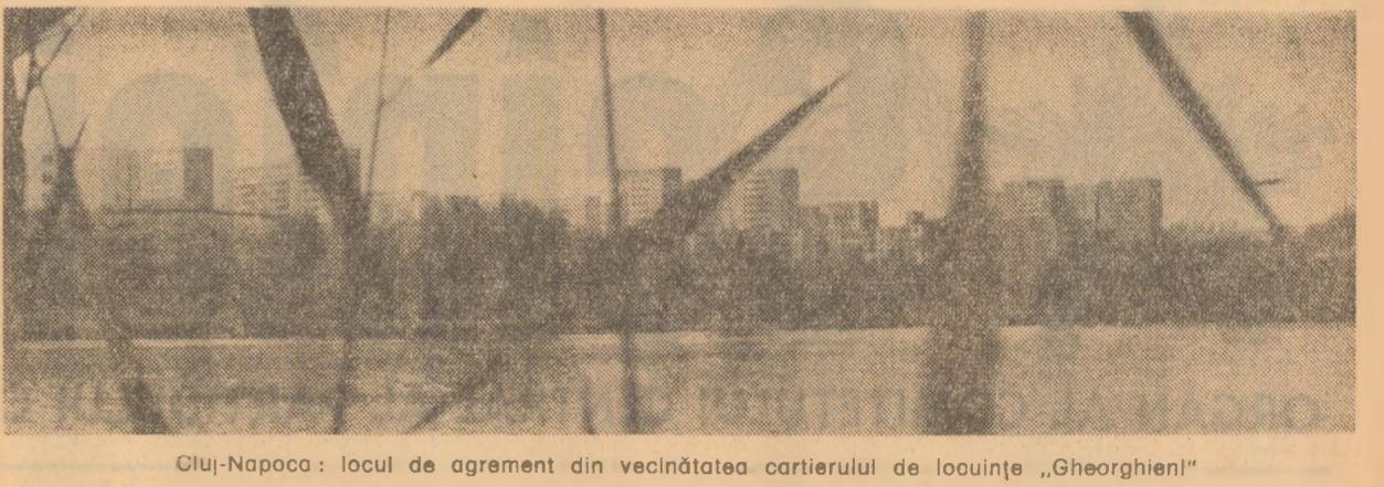
Cluj-Napoca: locul de acord din vecinătatea cartierului de locuințe „Gheorghieni”