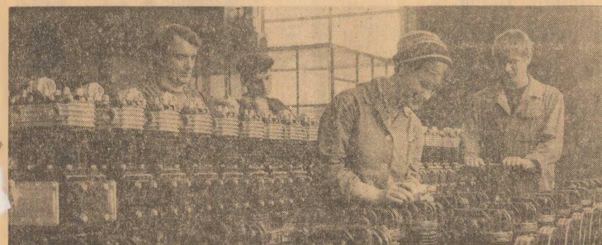
Intr-una din secțiile întreprinderii „Timpuri noi” din Capitală