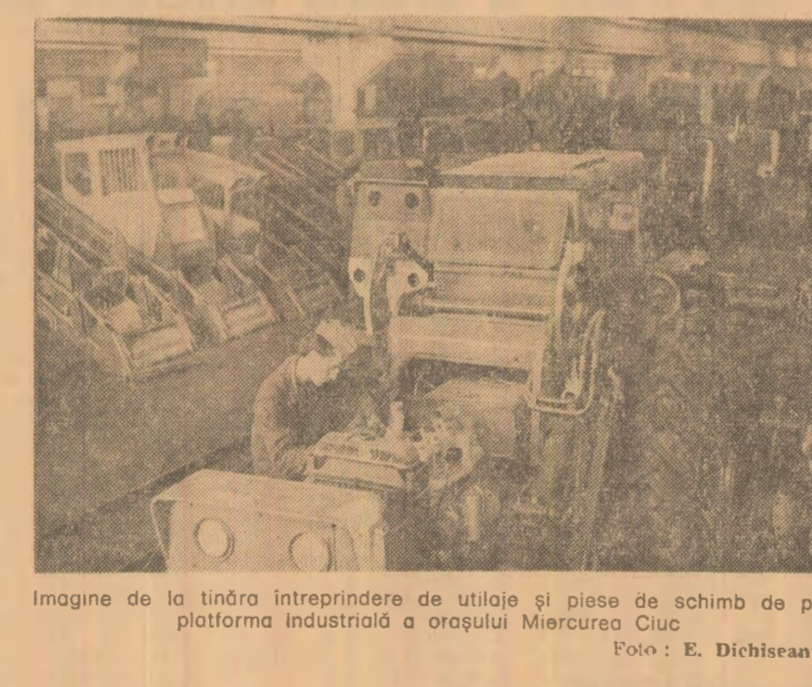
Imagine de la tîrnava întreprindere de utilaje și piese de schimb de pe platforma Industrială a orașului Miercurea Ciuc