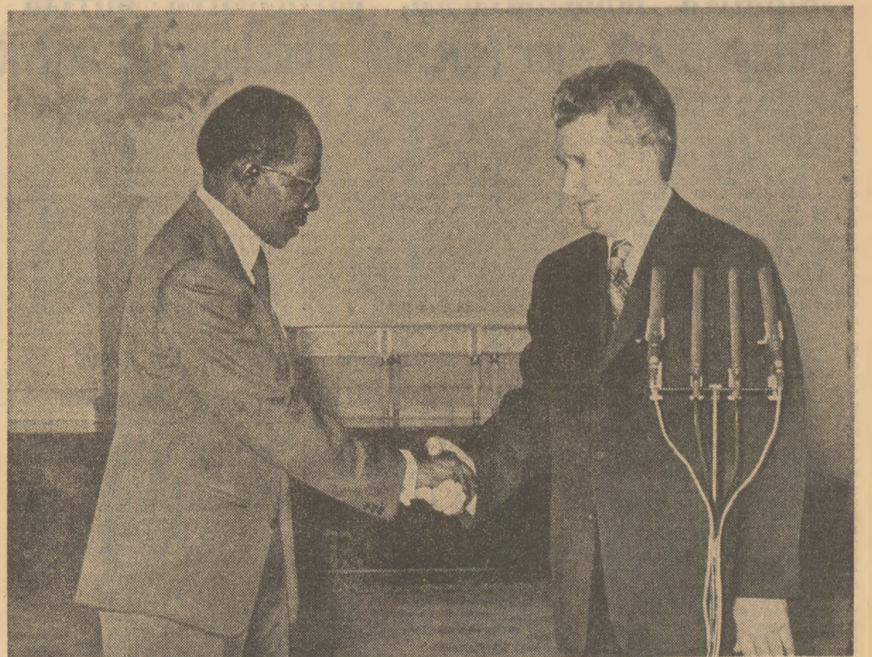
După semnarea documentelor oficiale

— să depună toate eforturile necesare pentru eliminarea completă a utilizării forței în relațiile internaționale, pentru recurgerea numai la mijloace pașnice în soluționarea diferendelor internaționale ; — să se abțină de la orice formă de presiune îndreptată împotriva independenței, suveranității și integrității teritoriale a altor state, să respecte cu strictețe principiul neinterferenței în treburile interne ale altor state ; — să contribuie la instaurarea păcii și justiției în lume, bazate pe respectarea strictă a principiilor universale recunoscute ale dreptului internațional ; — să militeze pentru stabilirea de raporturi juste și echitabile în relațiile economice între state, pentru adoptarea de măsuri hotărâtoare în vederea lichidării rapide a dezechilibrului dintre țările dezvoltate și cele în curs de dezvoltare ; — să acționeze pentru instaurarea unei noi ordini economice internaționale, fundamentată pe deplină egalitate în drepturi a tuturor statelor. V. În vederea aplicării prevederilor prezentei Declarații solemne comune, Republica Socialistă România și Republica Senegal declară voiața lor comună de a avea consultări în continuare, la diferite niveluri, pe căi diplomatice, prin schimburi de vizite și prin întâlniri periodice ale reprezentanților lor. Intocmită la București, la 24 aprilie 1976, în limbile română și franceză, în câte două exemplare, originale fiecare, toate având egală valabilitate și forță.