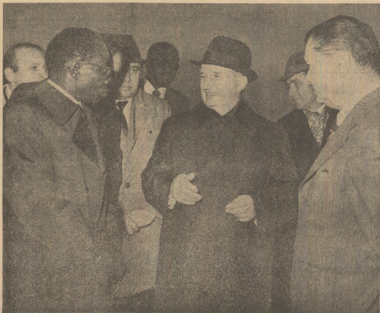
Imagini din timpul vizitei în Capitală

Relevind apoi că una dintre problemele de cea mai mare importanță în lume în momentul de față este aceea a instaurării unei noi ordini economice și monetare, șeful statului senegalez a scos în evidență necesitatea reducerii decalajului dintre țările avansate economic și cele în curs de dezvoltare, acționării pe multiple planuri pentru a se asigura condiții mai prietene de dezvoltare țărilor lumii a treia.