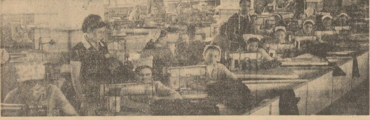
Aspect de muncă dintr-o secție fruntașă în întrecere, la întreprinderea de confecții din Vaslui