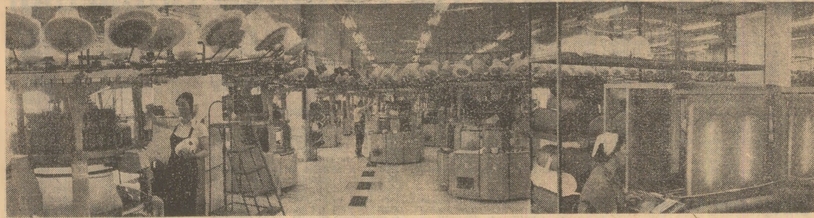
Într-una din secțiile întreprinderii de confecții și tricotaje din Capitală

Aici se află ratiunea de a fi a operii muzicale, a întregului efort de creație și gîndire teoretică, de educație muzicală, a activității interpretative a prezentului în săși a muzicii și muzicianului în societate. În pregătirea Congresului educației politice și culturale a tineretului, slujitorii artei sunetelor din patria noastră își vor spori strădaniile, așa cum s-au angajat, la recenta plenară largă, pentru realizări demne de cerințele contemporaneității, de tradiția și viitorul luminos al culturii noastre naționale, de eroicul efort de făurire a societății socialiste multilateral dezvoltate.