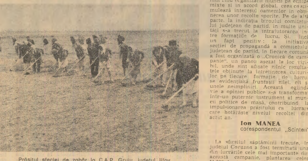
Prășitul sfeclei de zahăr la C.A.P. Gruiu, județul Ilfov

„Concomitent cu prășitul, pe terenurile amenajate pentru irigație se aplică și fertilizarea fazială. Pentru sfecla de zahăr însă, unitățile agricole nu dispun de utilități adecvate executării acestei operații. Erezînd interes inițiativă de la S.M.A. Vi-ziru, unde o parte din tractoare vor fi înlocuite roțile cu pneuri late ca altele înguste pentru a se putea trece cu fertilizatoarele purtate printrerindurile de sfecla. Un plus de aten-