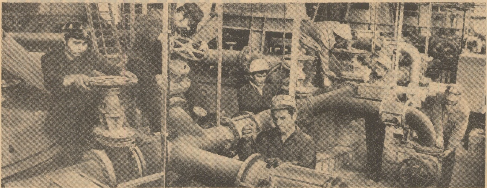
La Combinatul chimic din Turnu Măgurele se montează noi instalații