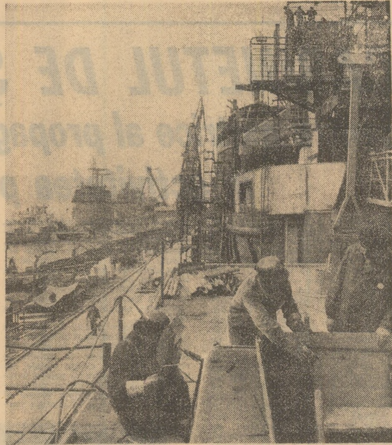
Șantierul naval din Oltenița: noi cargouri în construcție