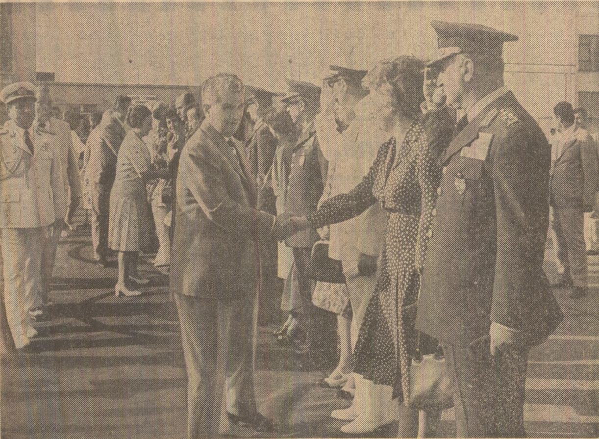
La plecarea, pe aeroportul din Istanbul

FAHRI S. KORUTÜRK Președintele Republicii Turcia