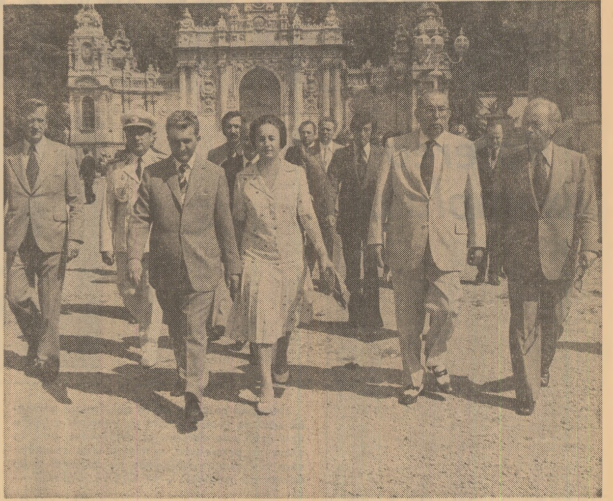
Moment din timpul vizitei la Palatul Dolmabahce