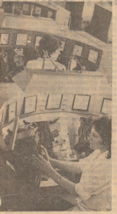
Aspect de muncă la „Electroaparator”-București

Rapidul „Stefan cel Mare” ne desprinde frumos — dis-de-di-mineată — din Gara de Nord, din Cetatea Bucurei, din inima Cîmpului Românesc, ca un bolid, ne duce în Tara de Sus, la Suceava. Treccm printr-un spațiu plin de culori, culorile inimă-tabile ale patriei noastre. Rămîn în urmă frumoase asezări ome-nesti, „codri verzi de brad și cîmpuri de mătăsă”, dealuri de mări domneste și de vin, vin ce va să de-vină bătrîn ca vremea, și — de ce nu? — „gru cu undelemn- precum în Eminescu. Am trecut de Roman, de Pașcanii lui Mihail Sadoveanu și a-lergăm, alerțăm mai departe, tot mai de-parte, învecinăm-ne de-acum cu ana Moldo-vei. Mă îmbăt — a-proape fără să știu — de o boare fără de asemănare ce vine de dinărore Bucovina. O boare ce vine de din-soroe Bogdănești, Baia, Mălini, Fălceni, Ră-dăsești, Ciprian Po-rumbescu, Fîntinele, Vorești, cu arome in-credibile pînă către Rădăuți, Vatra Moldo-vei, Vatra Dornei, Iz-voarele Sucevei, Put-na, Vicovul de Sus. Mă uit peste cîmpu-