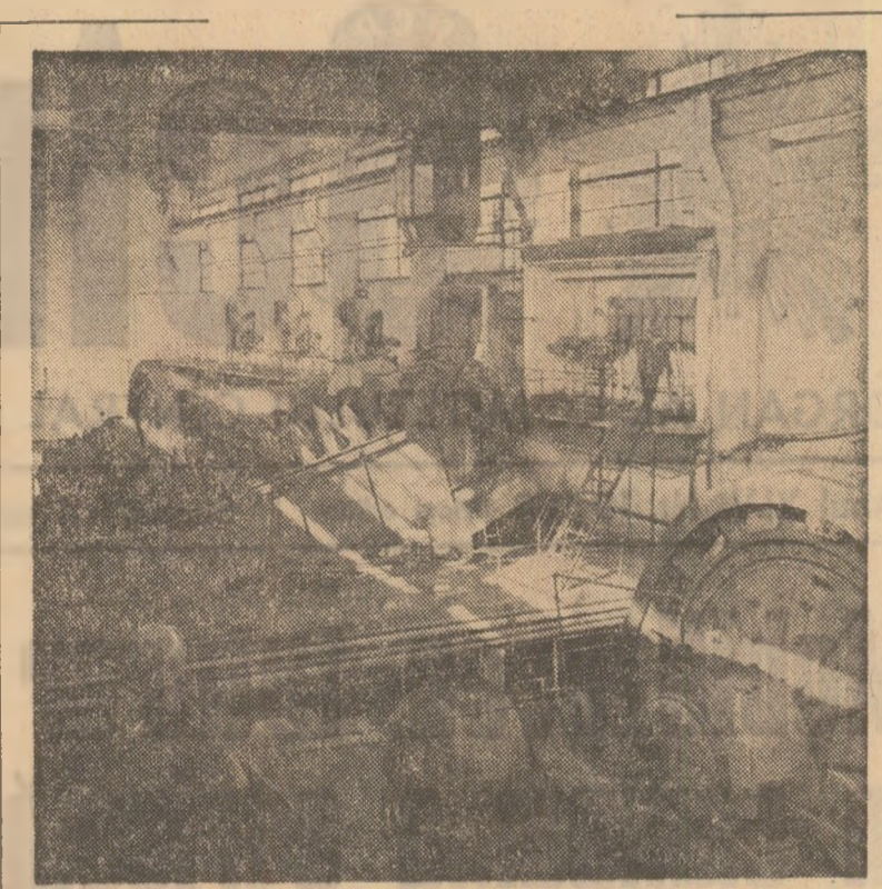
LA COMBINATUL MINIER DIN SUCEAVA Crește nivelul tehnic al producției

25 de noi membri, în marea majoritate tineri; s-a diversificat tematica sedințelor și adunărilor generale ale comitetelor și organizațiilor de partid, se pune un accent mai susținut pe răspunderea comunistilor pentru îndeplinirea exemplară a sarcinilor economice, dar și pentru formarea conștiinței socialiste a oamenilor. Mijloacele muncii politice-educative, revizitate și înnoite în spiritul expunerii tovrășului Nicolae Ceaușescu la Congresul educației politice și al culturii socialiste, sînt mai intense, mai judiciose folosite. În rîndul colectivului de constructori vasluieni se dovedesc eficiente asemenea metode ca munca de la om la om, foaia volantă „Constructorul”, filmele-anchetă realizate pe santierul „Treptele conștiinței”, „Contraste” — întîlniri cu activiștii de partid, oameni de știință, cultură și artă, juristi, dezbaterile pe probleme de etică sau cele vizînd responsabilitatea fiecărui fată de muncă și societate, organizate la cluburi, case de cultură și chiar pe santier. Appreciate sînt și programele culturale-artistice ale formațiilor de amatori ale