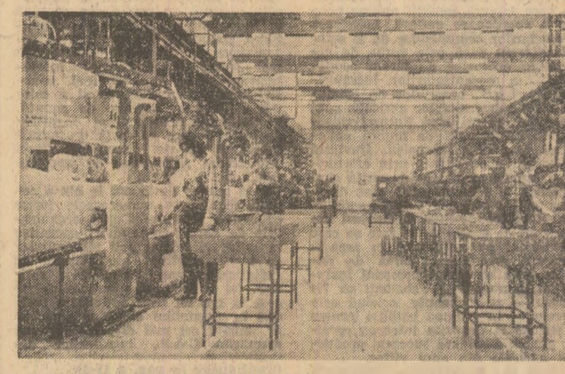
Imagine din secția rectificării la Întreprinderea de rulmenți din Brlad