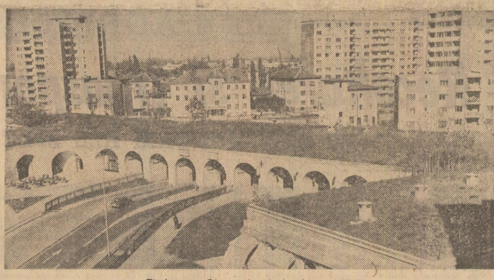
Timișoara: Din noul peisaj arhitectonic