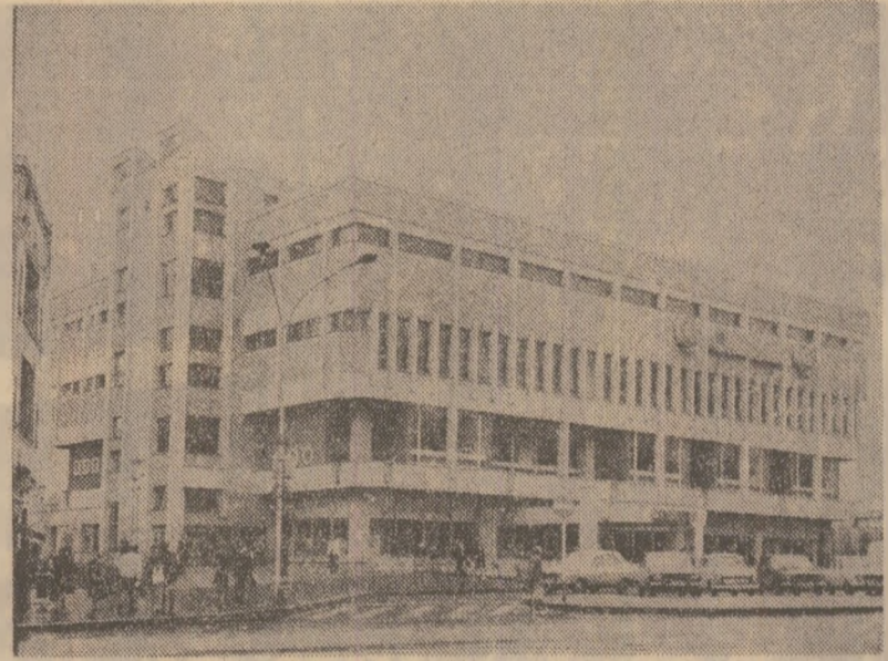
Magazinul universal „Omnia” din Ploiești