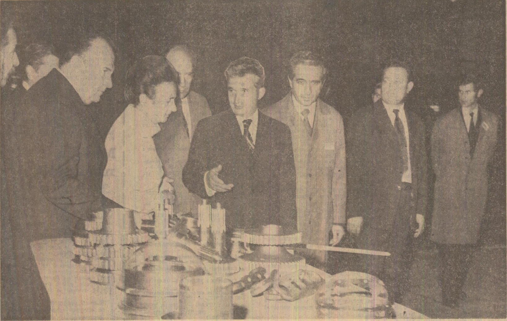
La Întreprinderea de piese auto și tractoare din Miercurea-Ciuc

În timp ce toți cei prezenți pe stadion acclamă cu însuflețire pentru patrie și partid, pentru secretarul general, elicopterul prezidențial decolază, îndreptîndu-se spre Capitală.