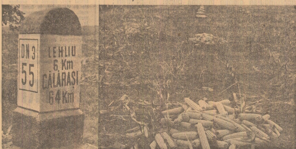
Porumbul cules nu trebuie așezat direct pe pămînt, mai ales pe acest timp ploios. Asemenea îmblăni ca cea surprinsă pe terenurile cooperativei agricole din Ștefănești, județul Ilfov, nu trebuie să se mai întîlnească.