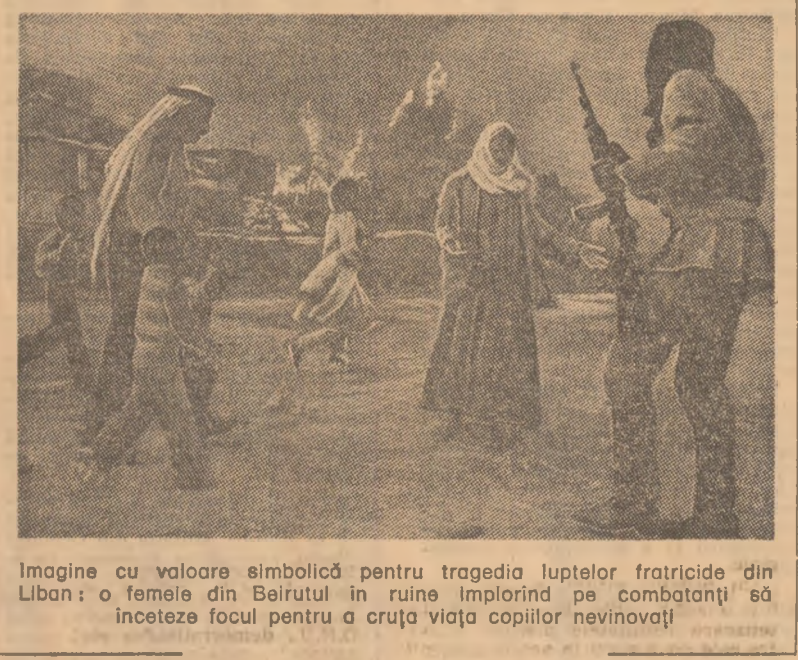
Imagine cu valoare simbolică pentru tragedia luptelor fratricide din Liban: 7 femeile din Beirut în ruine împing în comabații să înceteze focul pentru a cruța viața copiilor nevinovați