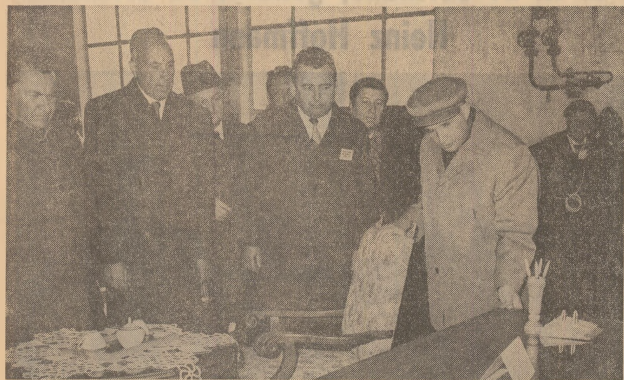
La Climpeni, în tinăra întreprindere de prelucrare a lemnului