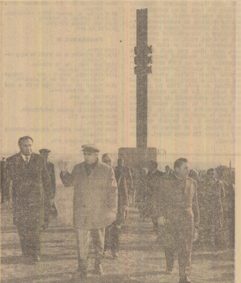
La Guruslău, unde secretarul general al partidului a inaugurat monumentul închinat victoriei lui Mihai Viteazul

La întreprinderea de armături industriale din fontă și oțel, în fața machetelor care înfățișează sugestiv situația folosirii spațiilor construite și amplasarea utilajelor, gazele raportează tovarășului Nicolae Ceaușescu că, de la precedenta vizită și pînă acum, producția globală industrială a crescut de 5,2 ori. Prin aplicarea unor măsuri organizatorice, indecele de utilizare a mașinilor urmează să sporească pînă în 1980 la 93—95 la sută. Sint prezentate apoi