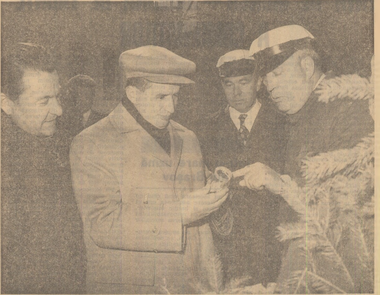
Discuții fructuoase, la Uzina de preparare a minereurilor de la Baia de Arieș

Cu această convingere și urez succese tot mai mari în întreaga activitate, multă sănătate și ferice-re! (Aplauze puternice, urale; se scandează: „Ceaușescu—P.C.R.”, „Ceaușescu și poporul”). Toți cei prezenți la adunare ovăionează minute în sir, într-o atmosferă de puternic entuziasm, pentru Partidul Comunist Român, pentru Comitetul Central pentru secretarul general al partidului și președintele Republicii, tovarășul Nicolae Ceaușescu.