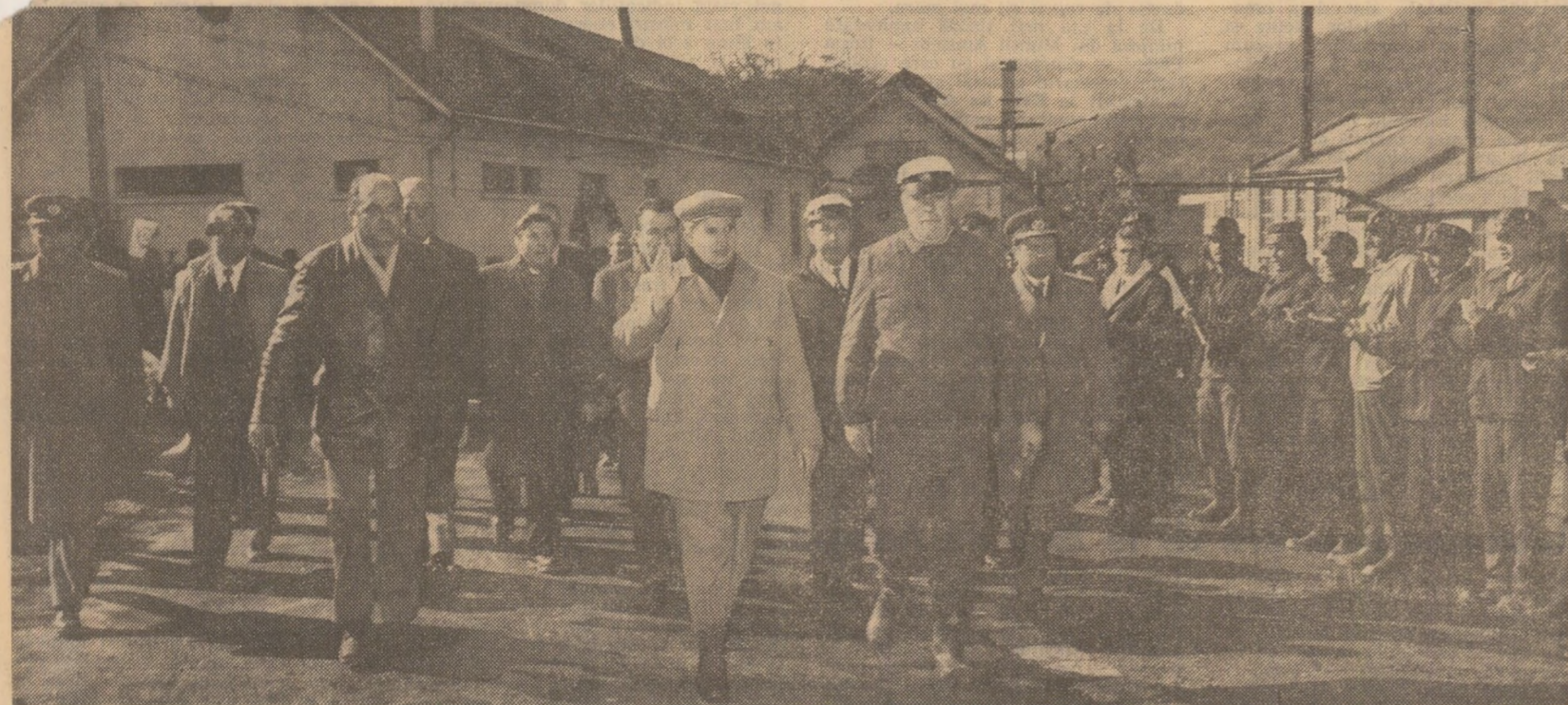
În mijlocul minerilor de la Baia de Arieș