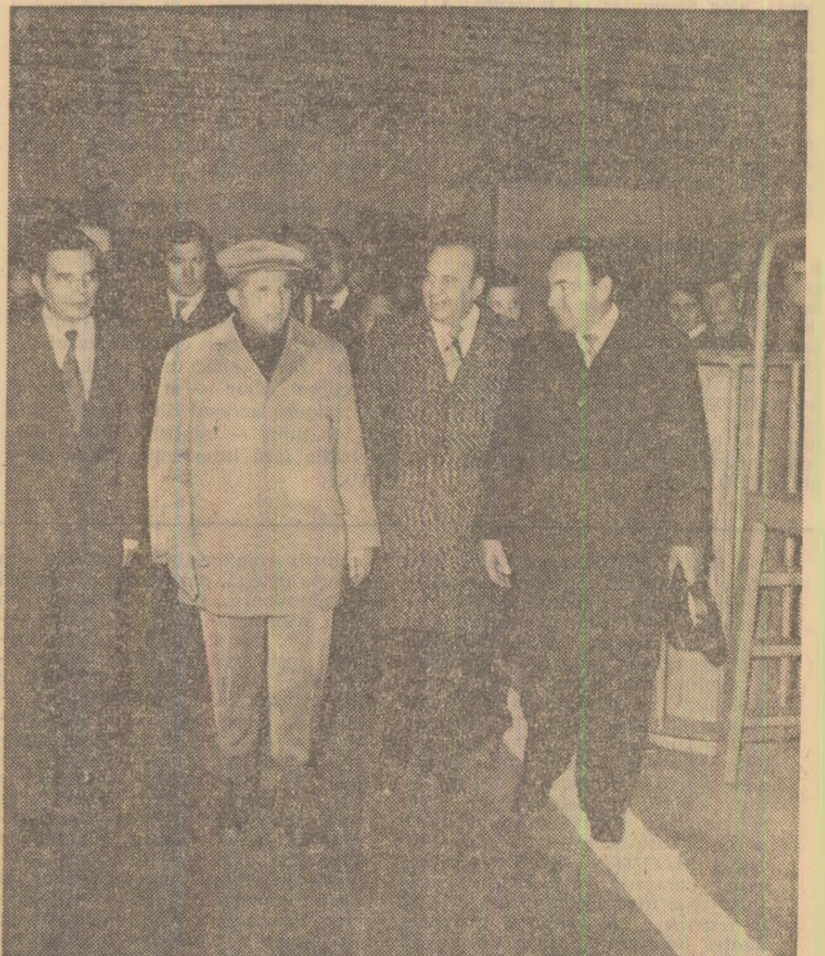
La cea mai mare unitate industrială a județului Sălaj, „Întreprinderea de conductori electrici emailați”-Zalău