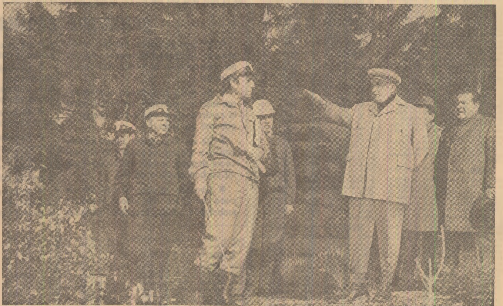
Dialog de lucru la noua carieră Rașia Poieni

LA GURUSLĂU: un emoționant moment de cinstire a eroismului marilor noștri înaintași