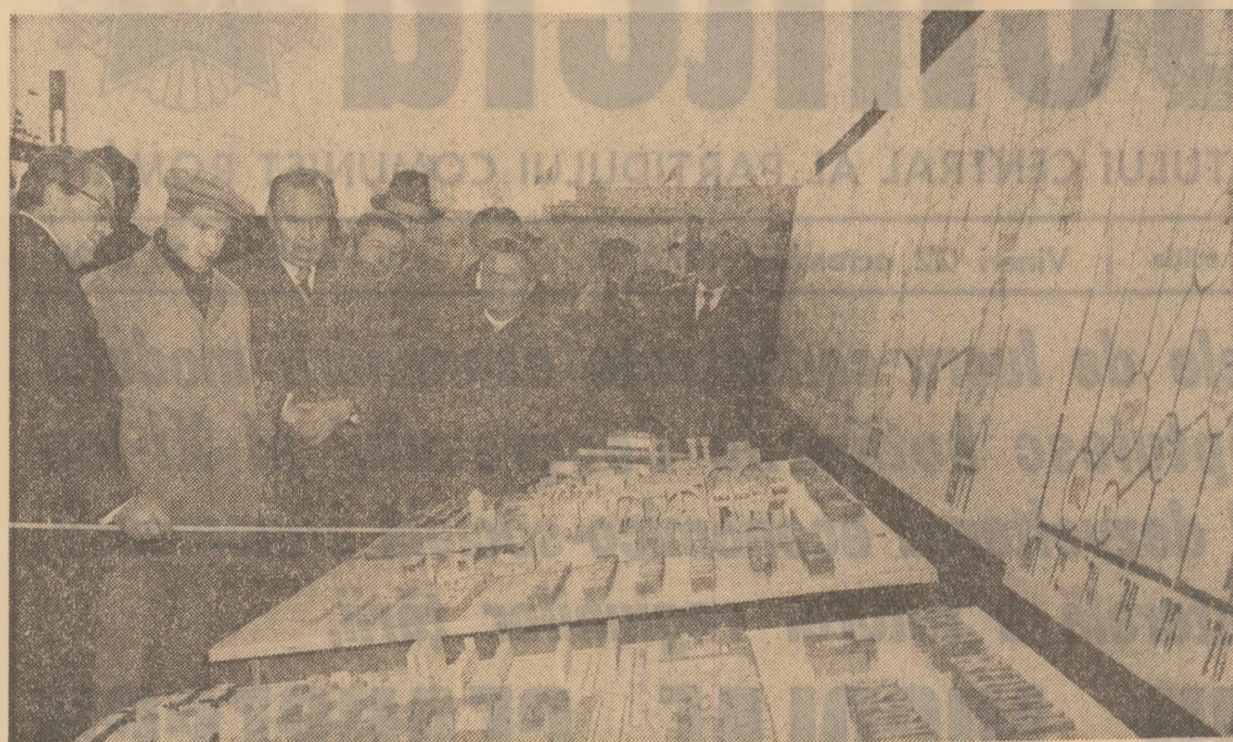
Raport de lucru în fața machetelor, la întreprinderea de armături industriale din fontă și oțel din Zălau

În continuarea vizitelor de lucru consacrate examinării directe, la fața locului, a rezultatelor obținute în îndeplinirea prevederilor primului an al cincinalului revoluției tehnico-științifice, a modului cum sînt transpuse în viață hotărârile partidului, Programul elaborat de Congresul al XI-lea de făurire a societății socialiste multilaterale dezvoltate pe pămîntul patriei noastre, secretarul general al Partidului Comunist Român, președintele Republicii, tovarășul Nicolae Ceaușescu, s-a aflat ieri în mijlocul oamenilor muncii din două județe ale Transilvaniei — Alba și Sălaj.