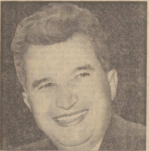
CEAUȘESCU Scrituri scelti 1975 Edizioni del Calendario

toate țările socialiste, solidaritatea cu tinerile state care și-au cucerit independența, colaborarea cu toate țările, fără deosebire de orînduire socială.