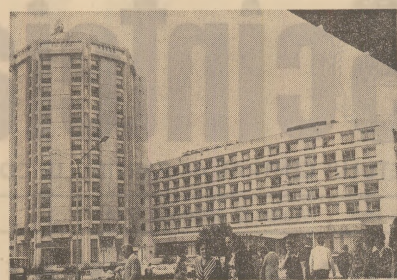
Din noua arhitectură a orașului Pitești

La o recentă analiză a stadiului insiloziilor furajelor în unitățile agricole din județul Olt s-au scos în evidență realizările bune obținute, punîndu-se accentul pe măsurile ce se impun pentru asigurarea în timp scurt a acestor acțiuni. Pînă la 1 noiembrie se insilozează peste 338.000 tone furaje. Este o cantitate destul de mare, dar ea nu reprezintă decît 66 la sută din cea prevăzută. Merită evidențiat faptul că în multe unități planul de insilozare a fost îndeplinit sau se depășește, în aceste zile, ultimele cantități de nutrețuri. De exemplu, în cooperativele agricole din cadrul consiliului intercooperatist Vîșina au fost asigurate 175.000 tone furaje, iar în cele din raza de activitate a S.M.A. Corabia - 157.000 tone. Cantități mai mari de nutrețuri au fost insilozate și în unitățile care fac parte din consiliile intercooperatiste: Tîrbeni - 119.000 tone, Ruscănești - 114.000 tone, Găneasa - 78.000 tone etc. De remarcă este și faptul că, în multe unități - Bucinșiu, Corabia, Movileni, Stoiceni și altele - s-au insilozat, în amestec cu grosiera, colțea și frunzele de sfeclă de zahăr, mărîndu-se astfel cantitatea de furaje, cît și calitatea acestora. De ce pe ansamblul județului a