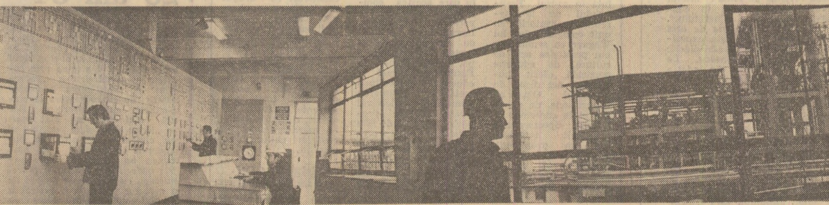
Intr-una din secțiile Combinatului chimic din Făgăraș

rim cu mai multă grijă, să folosim mai eficient, cu zigărelele chiar, fondurile materiale și financiare de care dispunem, astfel încît fiecare leu investit să dea maximum de rezultate economice.