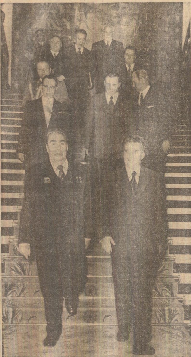
Imagini de la convorbirile de ieri dintre tovarășii Nicolae Ceaușescu și Leonid Ilici Brejnev

S-au evidențiat în mod deosebit voința de adâncire a relațiilor dintre P. C. R. și P. C. U. S., hotărârea comună de a deschide noi orizonturi colaborării multilaterale dintre România și Uniunea Sovietică în opera de construcție socialistă și comunistă, pentru cauza socialismului, progresului și păcii