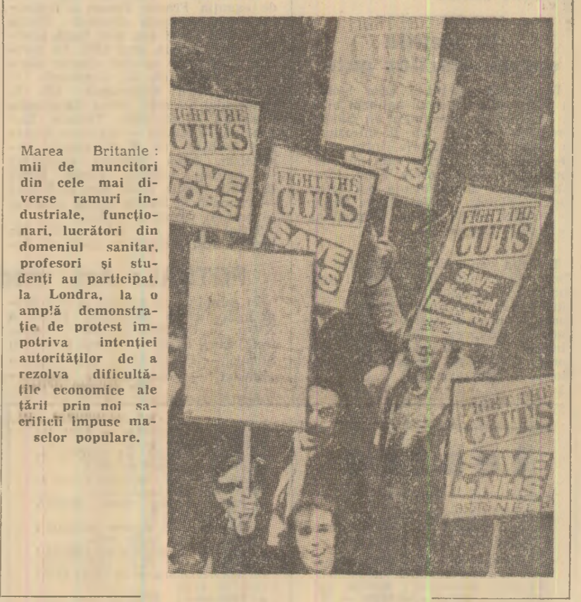
Marea Britanie: marea de muncitori din cele mai diverse ramuri industriale, funcționari, lucrători din domeniul sanitar, profesori și studenți au participat, la Londra, la o amplă demonstrație de protest împotriva intenției autorităților de a rezolva dificultățile economice ale țării prin noi măsurile impuse marilor factori industriali.