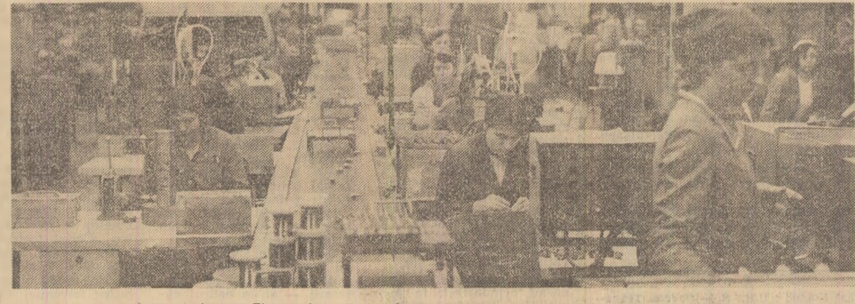
Întreprinderea „Electro-Arges” din Curtea de Argeș: aspect din hala de montaj.

La întreprinderea „Electrotehnica”, de pildă, unitatea II dispunea de condiții pentru creșterea producției de transformatoare de sudură de 130 A cu 40 la sută. Si totuși, aceste rezerve continuau să rămîna doar... rezerve, pentru că unitatea respectivă nu primea construcțiile metalice necesare. Constatind situația, comitetul de partid a cerut comunistii din atelier de construcții metalice să găsească soluții pentru a satisface integral aceste cerințe. Bineînțeles, căutarea lor nu trebuia să se prelungească pînă cînd... se utoa de ele — remarca tovarășul Aurel Iliescu, secretarul comitetului de partid. La s-a explicat oamenilor de ce este necesar să se acționeze cu operativitate și, după cîteva zile, problema era rezolvată: prin mecanizarea unor operații de îndoit care se executau manual, prin folosirea mai eficientă a mașinilor complexe de decupat și prin unele simplificări referitoare chiar la concepția produsului respectiv — in componența cărui intra cu 10 la sută mai puțin metal. Acum, la „E-