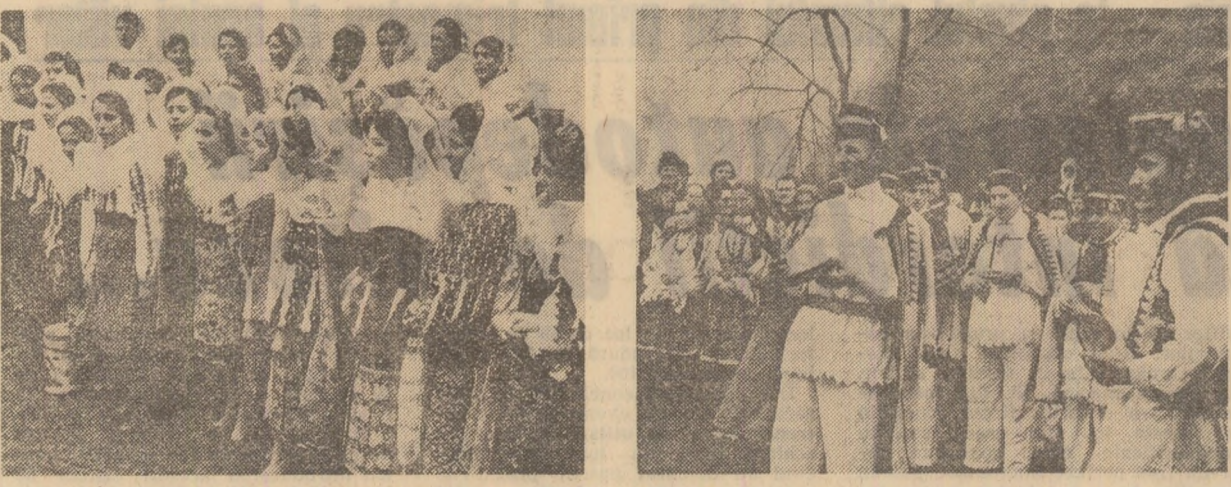
Duminică, la Muzeul satului din Capitală a avut loc un Festival al datinilor, manifestare la care și-au dat concursul formații de colindători din mai multe județe ale țării. În fotografii: imagini de la festival

17.45 Hochei: U.R.S.S. - Suedia. Transmisiune de la Moscova. 18.45 Anul de lumină al Republicii. 19.05 Teleshow pentru pionieri. 19.20 100 de seri. 19.30 Teleshow. 20.00 Anchetă TV: „Omul sfînteste locu”. 20.40 Teatru TV: „Noaptea e un sfîntet” - un spectacol de Alexandru Mironid. 21.15 Vedete internaționale. 22.40 Teleshow. PROGRAMUL II 25.05 De stim și ce nu stim despre... 26.05 Teleshow afirmări. 21.30 Telex. 21.35 Oameni și locuri. Poveste despre Louisiana.