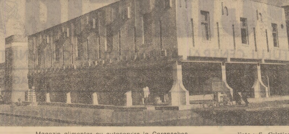
Magazin alimentar cu autoservire la Caransebeș