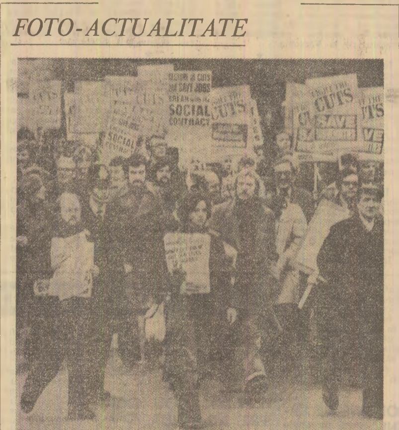
La Blackpool s-au încheiat lucrările Conferinței anuale a Uniunii naționale a studenților din Marea Britanie. Rezoluțiile adoptate la conferință se pronunță împotriva încercărilor de rezolvare a problemelor economice care confruntă țara prin reducerea cheltuielilor destinate asigurărilor sociale și învotămîntului în fotografie: Demonstrație de masă împotriva intenției autorităților de a reduce masiv cheltuielile publice, măsură ce s-ar răsfrînge nelavorabil asupra nevoilor sociale ale păturilor largi muncitoare