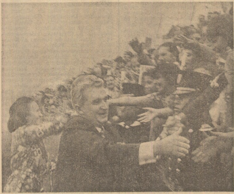
Sint încă vii în memorie călduroasele manifestări de prietenie și stimă prilejuate de vizita în Mexic a presedintelui Nicolae Ceausescu. Așa cum reiese din extrasele de presă adăugate, aceste sentimente persistă, determinând și în prezent manifestări de același gen. În fotografie: un aspect din timpul vizitei

CIUDAD DE MEXICO - În Isla de Cancun (Mexic) au început lucrările unei reuniuni a Sistemului Economic Latino-American (S.E.L.A.), consacrată constituirii Comitetului de acțiune a industriei de fertilizanti din cadrul acestei organizații economice regionale. Deși reuniunea se desfășoară cu ușile închise, observatorii apreciază că a un punct de pe ordinea de zi vii discută este cel privind acordarea, de către guvernele