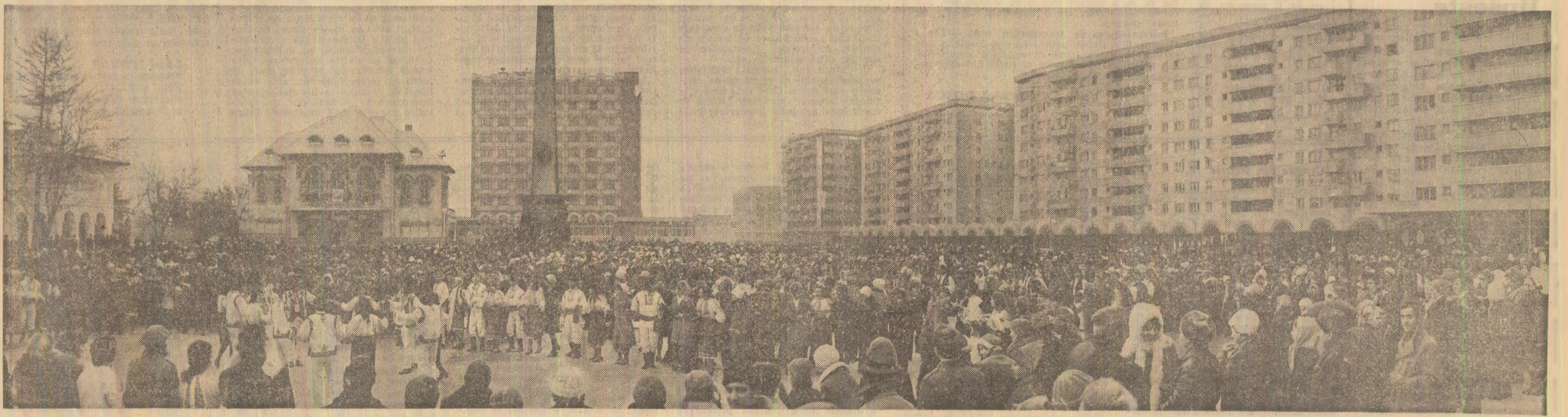
Focșani. În Piața Unirii, ieri, mii de cetățeni ai orașului au sărbătorit „lucrarea trainică a secole de istorie” — Unirea Principatelor — prin tradiționala Horă a Unirii

IN PAGINA A IV-A: Relatări ale unora dintre manifestările care au avut loc, cu acest prilej, în Capitală și în județele țării.