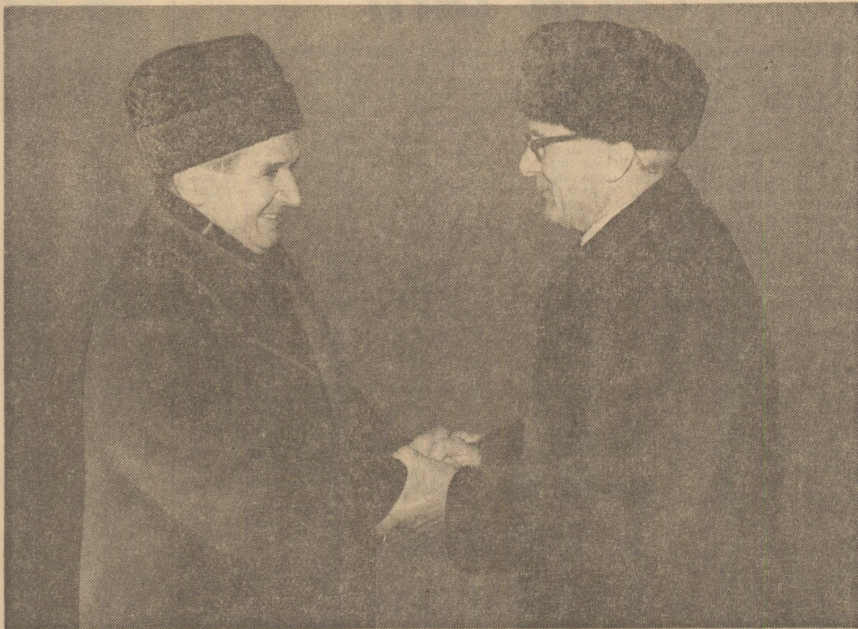
La sosire, tovarășii Nicolae Ceaușescu și Erich Honecker își string căduros minile

La invitația tovarășului Nicolae Ceaușescu, secretar general al Partidului Comunist Român, președintele Republicii Socialiste România, vineri după-amiază a sosit la București, într-o vizită de prietenie în țara noastră, tovarășul Erich Honecker, secretar general al Comitetului Central al Partidului Socialist Unit din Germania, președintele Consiliului de Stat al Republicii Democratice Germane.