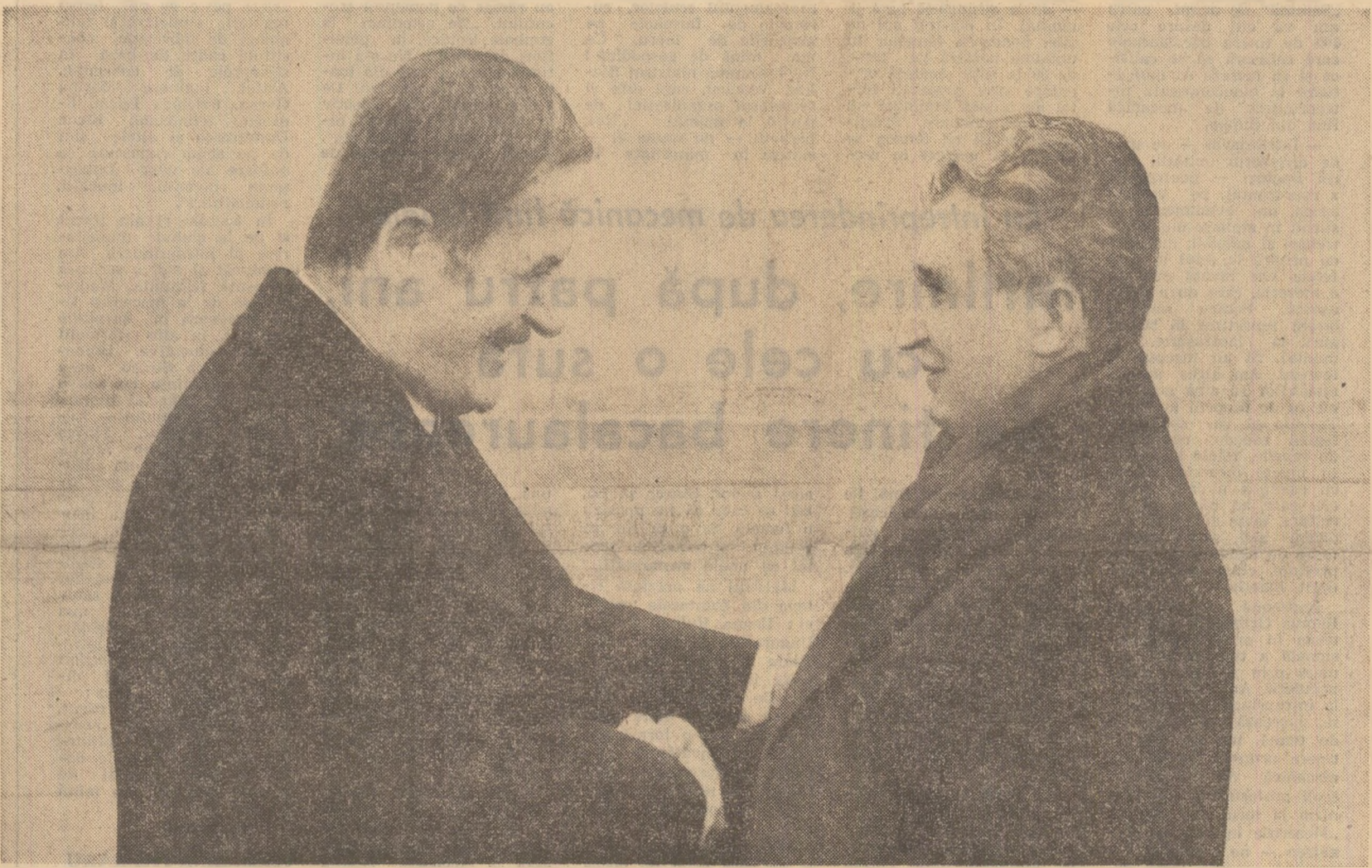
Reîntâlnire prietenească, la sosirea pe aeroportul Otopeni

La invitația secretarului general al Partidului Comunist Român, președintelui Republicii Socialiste România, tovarășul Nicolae Ceaușescu, marți a sosit în Capitală, într-o vizită oficială de prietenie în țara noastră, secretarul general al Partidului Baas Arab Socialist, președintele Republicii Arabe Siriene, Hafez Al-Assad. Noua întâlnire dintre președinții Nicolae Ceaușescu și Hafez Al-Assad, cea de-a cincea în seria dialogului la nivel înalt româno-sirian, constituie un eveniment de cea mai mare însemnătate în ansamblul relațiilor de strinsă prietenie și colaborare rodnică ce se dezvoltă între Partidul Comunist Român și Partidul Baas Arab Socialist, între România și Siria, între popoarele român și sirian. Ea reflectă hotărârea comună de a extinde și amplifica aceste raporturi, de a conlucra tot mai strâns pe țărmul vieții internaționale, de a acționa pentru instaurarea unei noi ordini economice și politice internaționale, în vederea soluționării problemelor complexe care confruntă omenirea, în interesul tuturor popoarelor, al dezvoltării lor libere pe calea progresului economic și social. Vizita reprezintă, în același timp, o manifestare elocventă a cursului mereu ascendent al bunelor relații pe care România le întreține cu țările arabe prietene, cu toate statele care au pășit pe calea dezvoltării de sine stătătoare, relații bazate pe