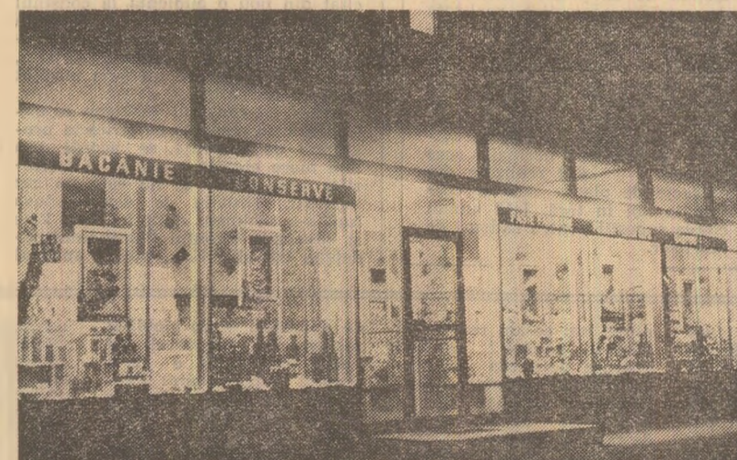
La magazinul alimentar cu autoservire din bd. Mărășești — București, risipa de energie electrică are program... neîntrerupt

După miezul nopții sîntem prezenți la ȘANTIERUL NAVAL. În hala de confecționat, zeci de becuri erau aprinse fără justificare, ele neavînd alt decît decorația, lumineze risipa. Un calcul sumar arată că, în fiecare oră, Frontului Unității Socialiste și a organizațiilor componente pentru organizarea și funcționarea controlului obștească. Participanții au adoptat în unanimitate propunerile făcute în plenul consfătuirii și pe comisii în legătură