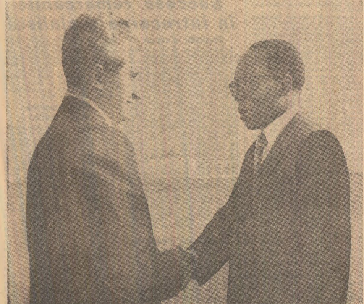
La plecare, pe aeroportul din Dakar

Sint convins, domnule președinte, că România și Senegal vor conlucra strîns pentru realizarea obiectivelor înscrise în comunicatul pe care l-am semnat puțin mai înainte. Aș dori să exprim speranța că ne vom reintîlni cit mai curînd în România. Doresc să vă urez dumneavoastră succese în tot ceea ce întreprindeți pentru dezvoltarea economico-socială a țării, urez poporului prieten senegalez multă fericire și prosperitate! (Aplauze)