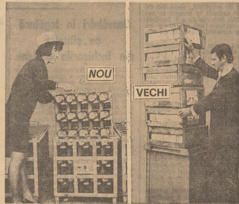
In paleta metalică din imagine încap 120 motoare electrice pentru ștergătoare de parbriz la autoturisme. Ocupă un volum de 0,85 mc. PRIN INTRODUCEREA SA SE ECONOMISESC ANUAL 30 TONE CARTON ONDULAT ȘI 120 MC LEMN. SE POATE REFOLOSI DE CIRCA 100 ORI, în vreme ce cutiile de carton din vechiul sistem de ambalare se utilizează o singură dată, iar lăzile de cherestea de 3-5 ori.

sau sortimente diverse de motoare. Totuși, sînt și alte cauze. De pildă, pînă de curînd, gara Pitești nu dispunea de suficiente mijloace mecanice de încărcare; totodată, nu ne accepta unele tipuri de palete metalice, pe care trebuia să le introducem în containere. (Nota redacției: ÎN STATUL DE CALE FERATĂ PITEȘTI, în intervenția noastră, s-au găsit pe loc posibilități de expediere în boxe-palete, în loc de containere și s-a sugerat ideea unor perfecționări ale paletelor metalice respective, pentru a mări securitatea transportului). Ar fi de relevat și faptul că, în prezent, municipiul Pitești nu dispune de o stație de cale ferată amenajată și dotată pentru transcontainerare, iar din cîte cunoaștem nu sînt perspective ca problema să se rezolve în scurt timp.