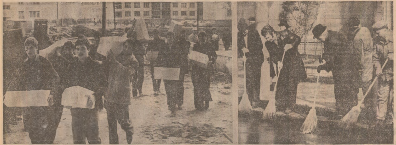
Mai mult ca oricînd să dovedim că sîntem buni gospodari. Să putem spune: „Ca și cum n-ar fi fost”