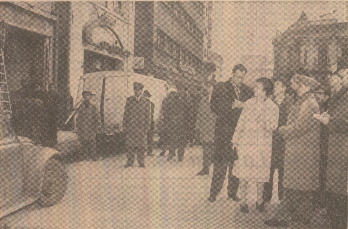
Pe Calea Victoriei

lor sanitare, medicii care au luptat parte la acest dialog cu tovarășul Nicolae Ceaușescu, exprîmînd mulțumiri pentru această vizită de încredință și îmbărbătare în munca lor plină de răspundere. I-au asigururat pe secretarul general al partidului că își vor pune nu numai priceberea lor profesională, ci și inima și tot sufletul în slujba salvării oamenilor, a vindecării rănilor lor, pentru a-i reda cit mai repede societății.