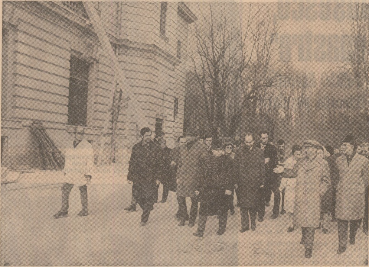
La Facultatea de medicina