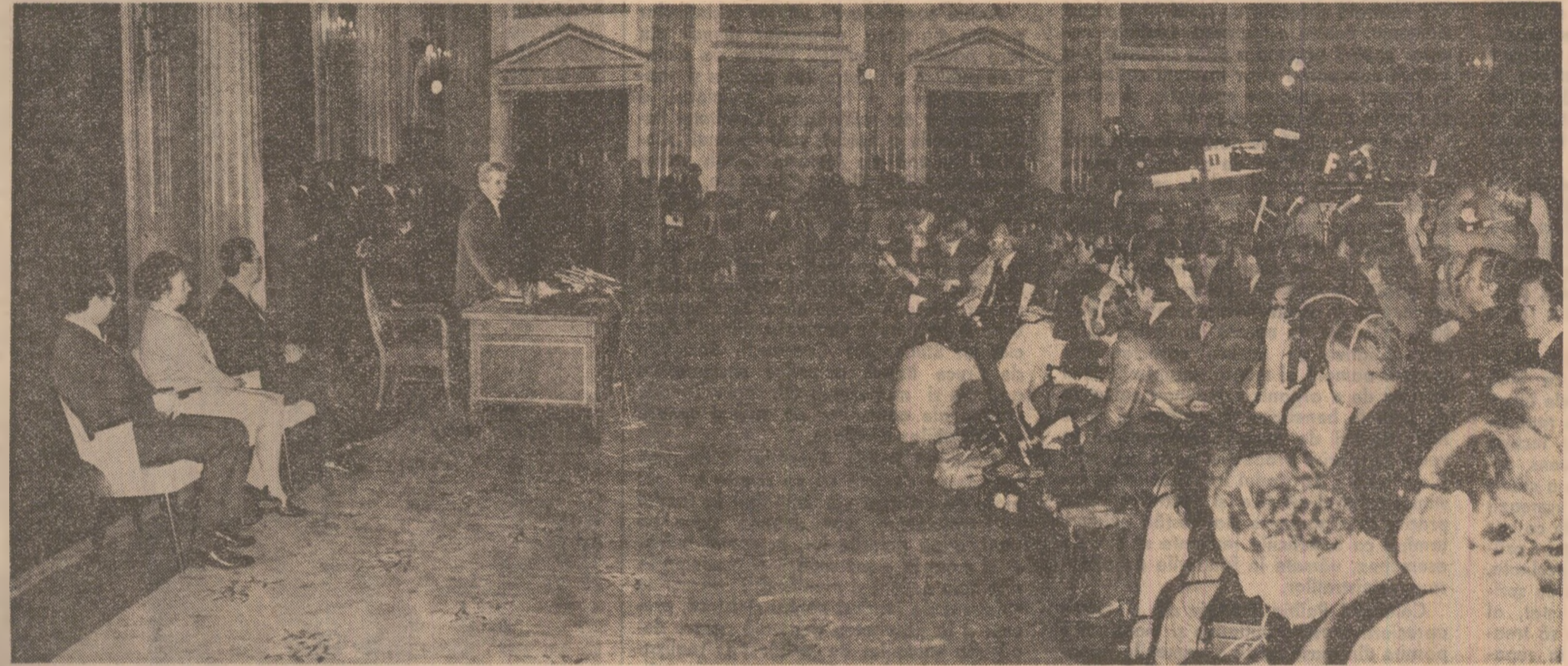
pentru a exprima public multumirilor acestor două state pentru felul cum au înțeles să-și exprime solidaritatea și să ajute România în aceste momente.

RĂSPUNS: Am spus deja că mai multe state au trimis, de la început, medicamente.