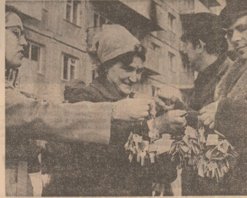
În fața blocului din str. Verigii nr. 4, viitorii locatari — persoanele năpustite de cutremur — sînt așteptați cu cheile noilor apartamente, cheile grîii calde, generoase