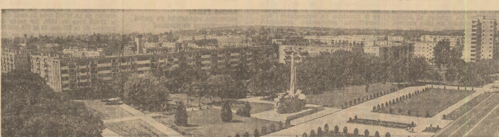
Imagine din orașul Corei