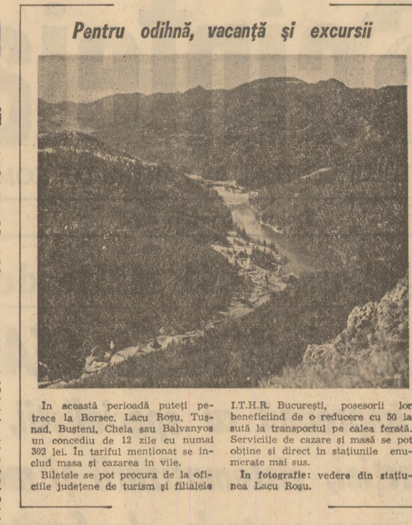
Pentru odihnă, vacanță și excursii