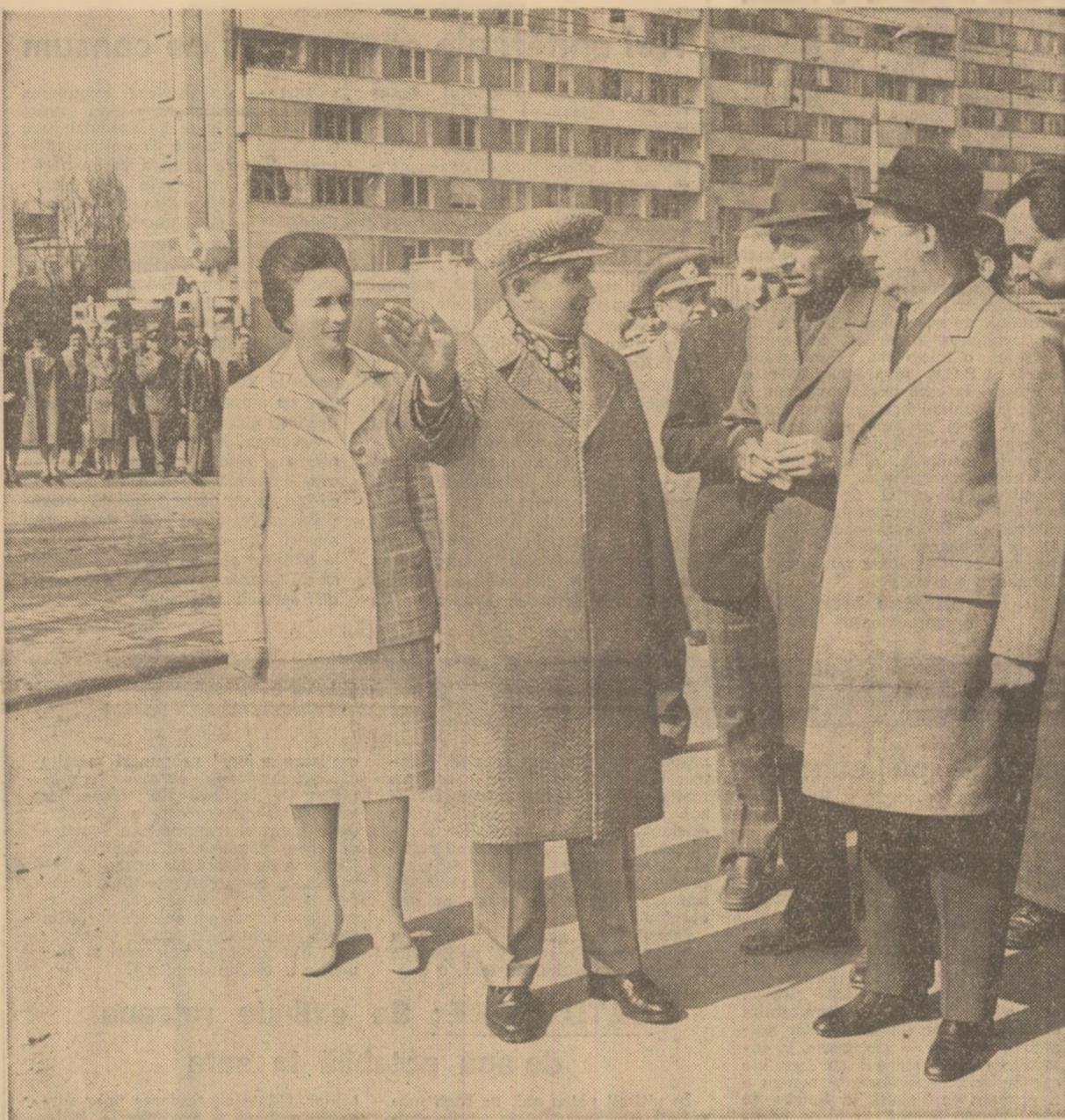
Intodeauna un important vad comunist.