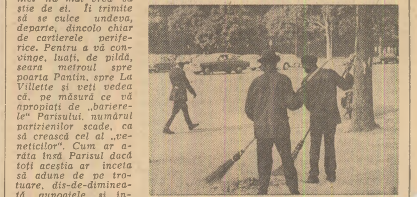
Muncitorilor imigranți li sînt rezervate numai asemenea slujbe

La Paris lucrează o mulțime de femei și bărbați veniți din diverse țări ale lumii a treia - scrie revista franceză „NOUVEL OBSERVATEUR”. Pot fi văzuți spîndînd geamurile edificiilor publice, săpînd santuri pe marginile bulevardeilor, în vederea montării unor conducte de canalizare noi. În general, ei sînt cei care efectuează toate muncile necalificate pe care le presupune întreținerea capitalei. Odată cu căderea nopții, cînd aceștia au terminat munca lor extenuantă, Partidul nu mai vrea să știe de ei. Ei trimit să se culce undeva, departe, dincolo chiar de cartierele periferice. Pentru a vă convinge, luați de pildă, seara metroul spre poarta Pantin, spre La Villette și veți vedea că, pe măsură ce vă apropiați din dorul „le” Parisului, numărul parizienilor scade, ca și creșcă cel al „veneticilor”. Cum ar arăta însă Parisul dacă toți aceștia ar înceta să adune de pe trotuare, dis-de-dimineață, gunoarele și întreaga murărie? Fără această muncă de întreținere și curățire a