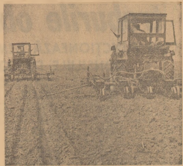
Organele și organizațiile de partid, comandamentele locale au datorat să acționeze cu stăruință pentru ca, în săptămîna care urmează, să fie însămîntată cea mai mare parte din suprafața prevăzută a se cultiva cu porumb

Temperatura solului și condițiile de lucru sînt foarte bune, ceea ce permite ca, în săptămîna care urmează, să se treacă din plin, cu toate forțele, la semănatul porumbului. Aceasta presupune ca, printre-o bună organizare a muncii, să fie folosită din plin fiecare oră bună de lucru, să se muncească din zori și pînă în noapte. Condițiile climatice din această primăvară — temperaturi mai ridicate decît în alți ani și lipsa precipitațiilor — impun ca semănatul porumbului să se facă într-un timp mai scurt. Înțelegînd această necesitate — așa cum rezultă din informațiile soseite la redacție — numeroși mecanizatori și cooperatori au hotărît să transforme duminica într-o zi obișnuită de lucru. Conducerea unităților agricole, specializate din agricultură, șefii secțiilor de mecanizare au datăbă să fie prezenti în cîmp pentru a asigura o bună organizare a muncii și rezolvarea operativă a oricăror probleme, astfel încît tractoarele și masinile agricole să fie folosite la întreaga capacitate, din zori și pînă seara.