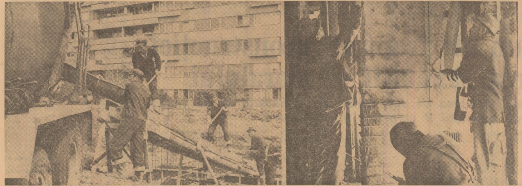
În numeroase cartiere ale Capitalei se înalță, în ritm rapid și în condiții de calitate sporită, noi blocuri de locuințe. În ajutorul constructorilor bucureșteni au venit sute de lucrători din județele țării. Bundoară, în cartierul Drumul Taberei — imaginea din stînga — constructorii maramureșeni vor ridica în acest an 200 de apartamente. Totodată, în Capitală se înalță în ritm susținut la refacerea clădirilor afectate de cutremurul din 4 martie. Specialiștii și constructorii analizează cu atenție fiecare clădire, elaborează și aplică soluții tehnice menite să asigure o rezistență și durabilitate ridicate acestor imobile. Așa se procedează și la blocul „Turist” din Piața Romană, de unde prezentăm imaginea din dreapta. (Ilie Sturab)