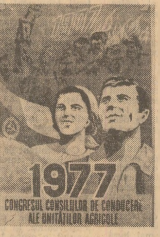
1977 CONGRESUL CONSILIILOR DE CONDUCERE ALE UNITATILOR AGRICOLE

Acesta este unul din secretele marilor succese ale cooperativărilor din Salonta