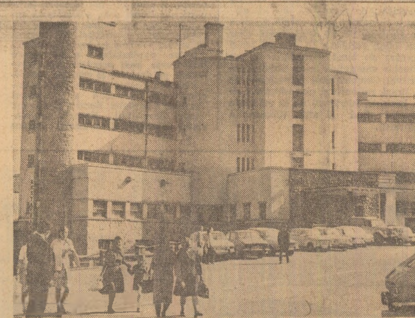
La Sinaia, oaspeții, ca și localnicii, vizitează deseori complexul turistic de la Cota 1400