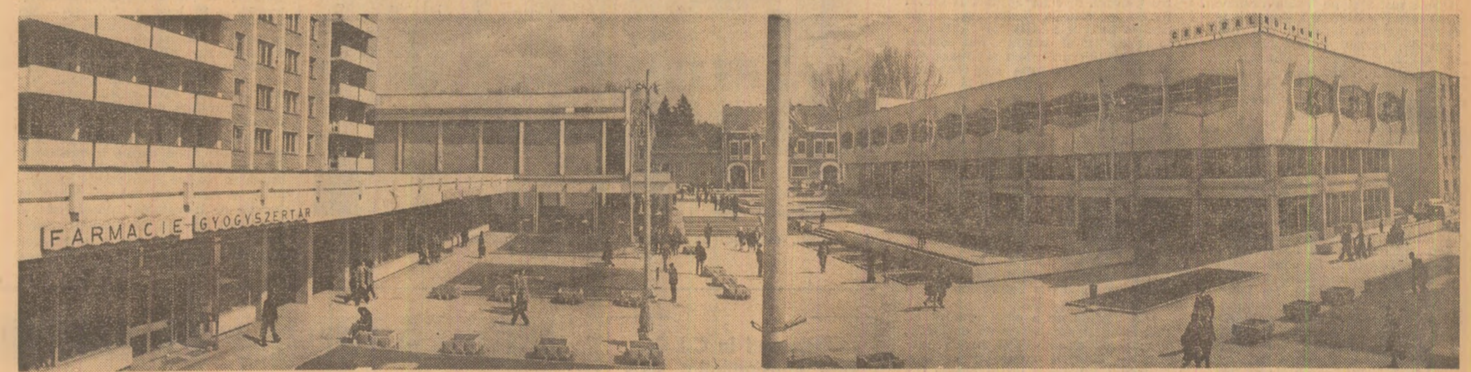
Noua arhitectură a orașului Miercurea Ciuc

pentru frumos, sub orice formă s-ar manifesta el. După cutremurul muncitorilor din gările patriotice, pînă la viața în pericol pentru salvea oamenilor, au mai găsit în palmele lor bătuțute care îndoiu bare de fier și săpau tunele prin moloz, destulă rîngășie pentru a pipăi o statuie îngrozită, a salva o pînză. Și în astfel de condiții vitrege, catastroale — ca inundațiile ori cutremurul — pornirea spre artă s-a manifestat din plin, lucru firesc la un popor plin de vitalitate, dornic de orizonturi largi, într-o lume a păcii și colaborării, în care fiecare să strălucască potrivit puterii spirituale și genului fiecărui popor, mare sau mic, atîtea comori de artă umanistă care trebuie cunoscute de toți. O cunoaștere făcută să întărească statură fizică și morală reciproc, a înțelegii între popoare atît de necesară pentru afirmarea puterii creatoare a umanității.