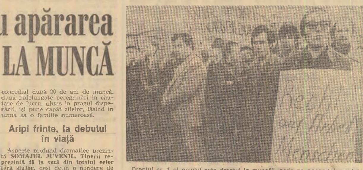
„Dreptul nr. 1 al omului este dreptul la muncă”, scrie pe pancartele purtate de muncitorii de la uzina Felten și Guilleoume din Köln (R.F.G.)