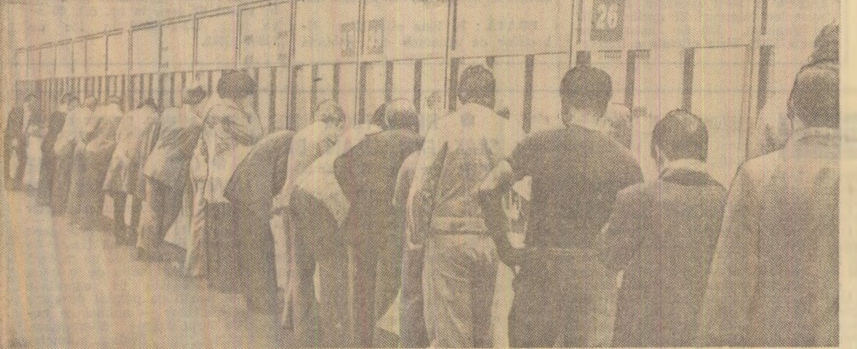
COZILE UMILINȚEI. Ore îndelungi de așteptare în fața ghișeeilor pentru primirea ajutorului de șomaj