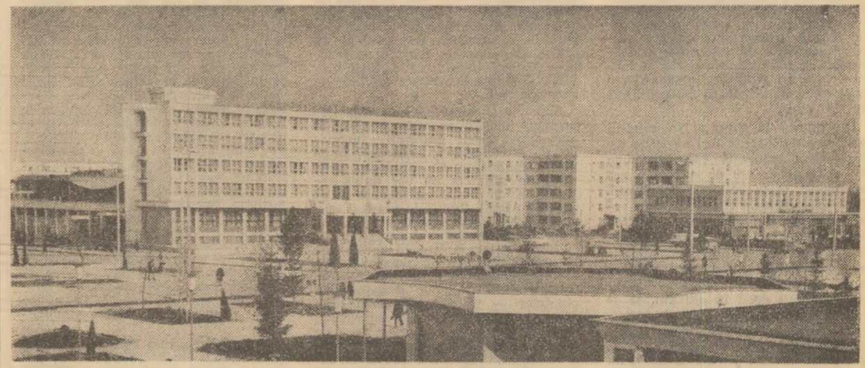
Slobozia. Vedere din centrul orașului.

În conformitate cu înțelegerea anterioară, între tovarășul Nicolae Ceaușescu, secretar general al Partidului Comunist Român, președintele Republicii Socialiste România, și tovarășul János Kádár, prim-secretar al Comitetului Central al Partidului Muncitoresc Socialist Ungar, va avea loc, în zilele următoare, o întâlnire prietenească, în zona de frontieră, la Oradea și Debrecen.