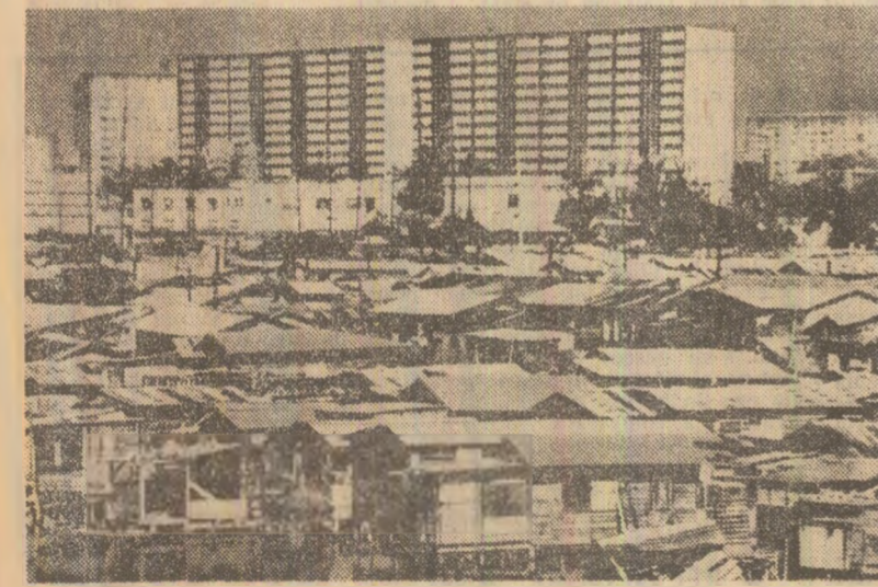
O imagine edificatoare care poate fi întîlnită în orice metropolă occidentală