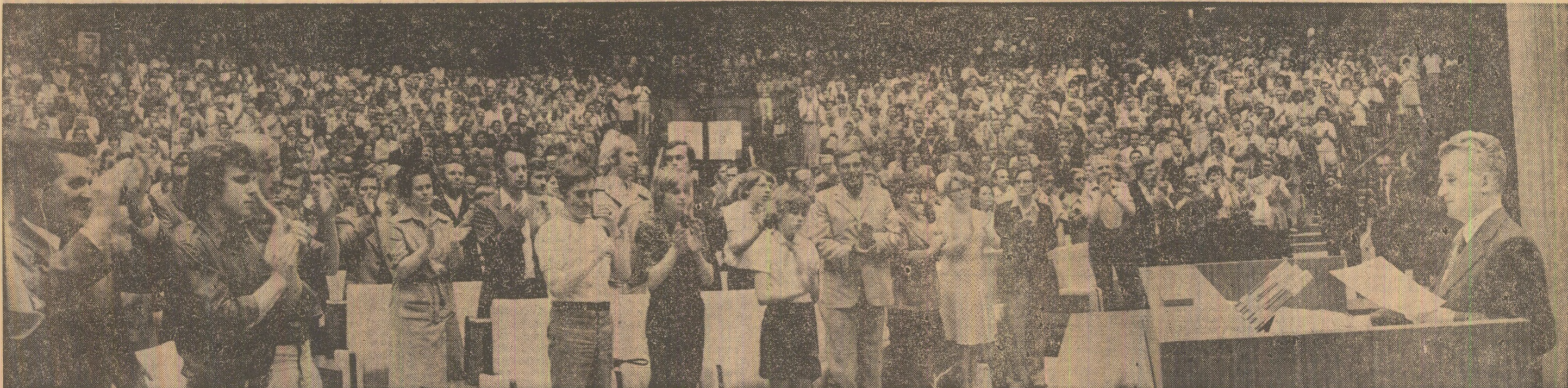
La marele miting al prieteniei de la Berlin