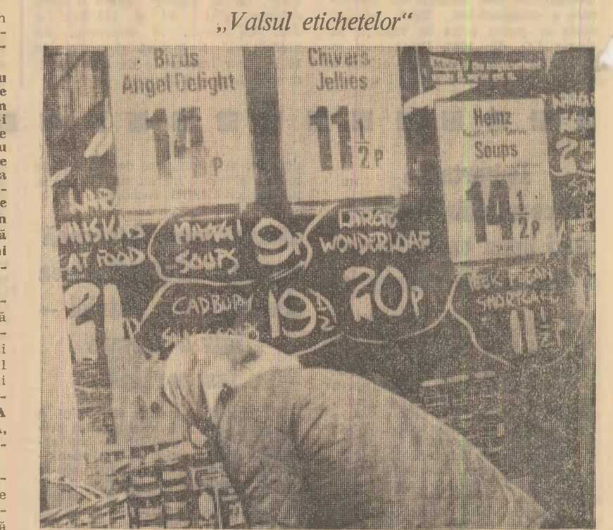
Gospodinele din țările occidentale — cum este cea din fotografie — constată cu dureroasă surprindere că prețurile principalelor bunuri alimentare cresc de la o zi la alta...

Procesul inflaționist își găsește expresie într-o vertiginosă ascensiune a prețurilor. Recent, Oficiul statistic al Comunității Economice Europene a dat publicității date globale asupra creșterii prețurilor la bunurile de consum în cele țări vest-europene care fac parte din C.E.E.