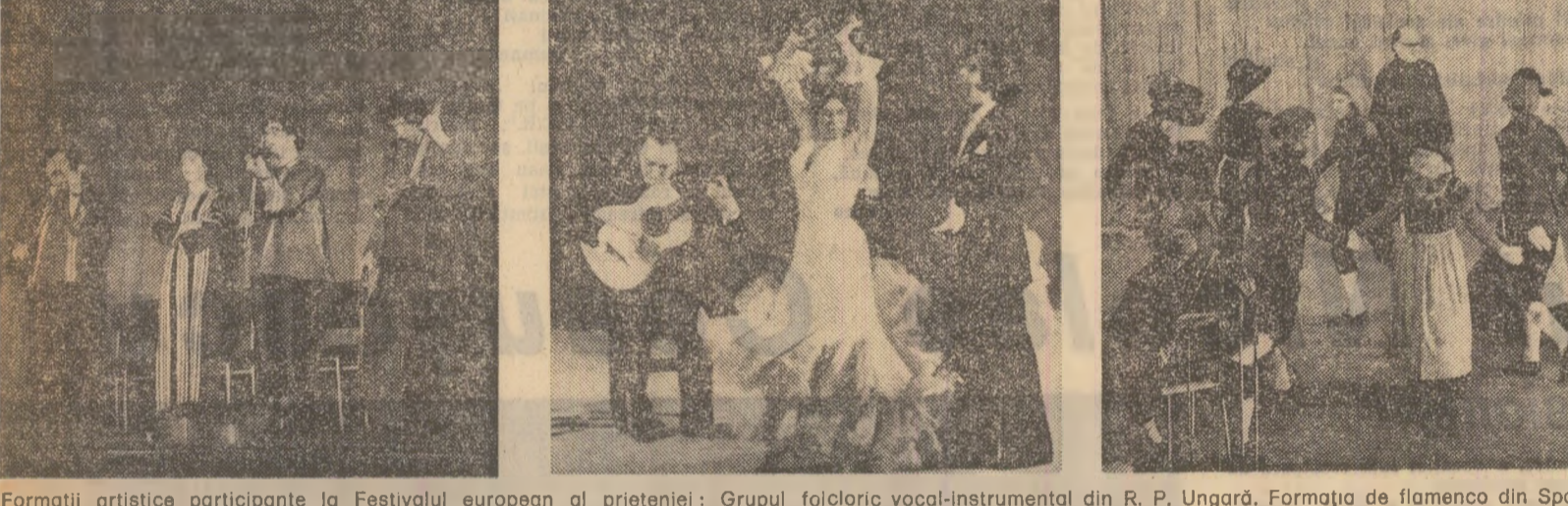
Formații artistice participante la Festivalul european al prieteniei: Grupul folcloric vocal-instrumental din R. P. Ungară, Formația de flamenco din Spania și ansamblul „Holstebro Folkedansere” din Danemarca