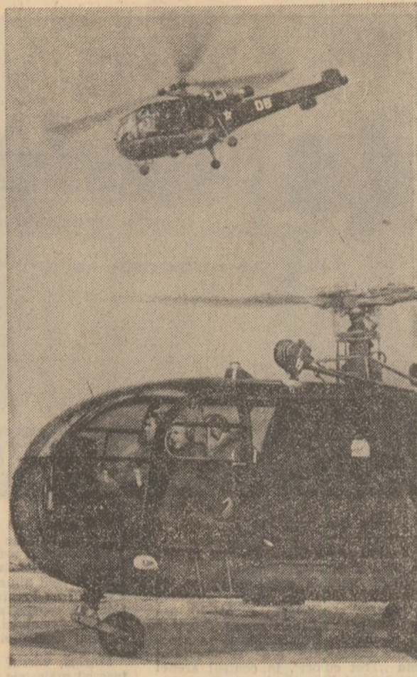
Șă răminem între patru săli pentru a putea discuta în voce și pentru a preciza că...

— „Aici, în unitate, să stii, au crescut mulți piloți, comunisti ca Turea. S-a scris, nu de mult, și în ziarul armatei, despre cei care au salvat un grup de naufragiați străini pe o vreme de furtună. Aici-s-au format ca piloți.