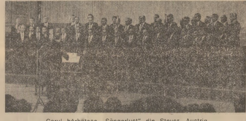
Corul borbătesc „Sängerlust” din Steyer, Austria

Ne-am întâlnit în cadrul Festivalului european al prieteniei cu un tinăr ansamblu coregrafic: Baletul Teatrului din Atena. Tinăr, pentru că deși înființat în 1959, Grupul de dans al lui Yannis Metsis — cunoscut balerin și coregraf — a început să activeze pe linia teatrului atenean doar în 1973. Un an mai târziu a fost admis în Asociația culturală „Prietenii dansului”, apoi a început seria festivalurilor naționale (Salonic, Pircu, Atena), internaționale (Corfu).