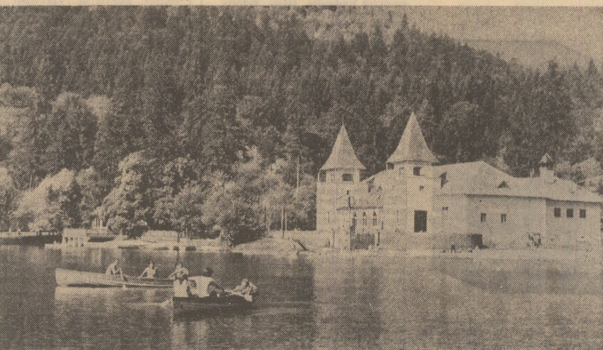
Pe lacul Ciucaș de la Tușnad

Mihai BĂZU Georghe CİRSTE coredenții „Scintei”