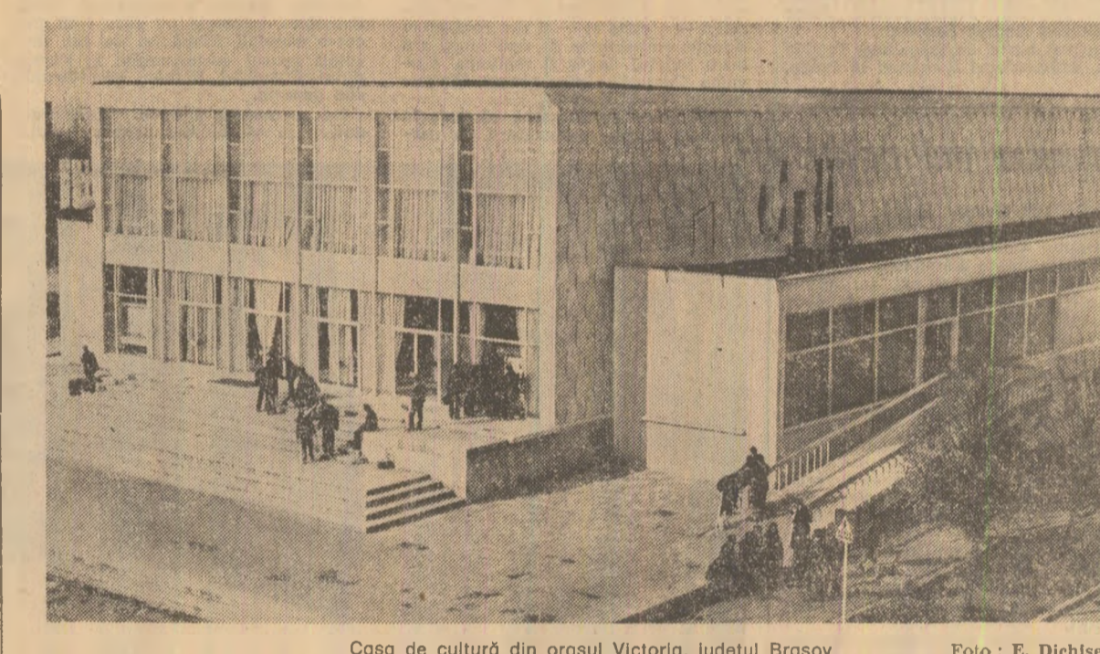
Casa de cultură din orașul Victoria, județul Brașov.