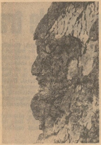
Cap de dac? Sculptură modernă?

Intrebări pe care și le pune — și ni le pune — cititorul nostru F. Adrian din Piatra Neamț. Imaginea de mai sus, premită ieri la redacție, este însoțită de următoarea explicație: „Nu. Nu este cap de dac. Este o sculptură al cărei autor este natura. Cine nu crede, îl potfece să facă un scurt popas pe dealul de pe raza comunei Ștefan cel Mare, nu departe de soseaua de largă circulație Roman — Piatra Neamț. Aici va întâlni o stâncă de mari dimensiuni care închipuie imaginea de mai sus, unică în felul ei. Cu o condiție: să ai norocul să prizi o zi frumoasă și, mai ales, să găsești unghiul cel mai potrivit. Credeți că eu am reușit? Da, și încă foarte bine, mai ales că ne-am convins că imaginea este fără retuș. De altfel, nici nu avea nevoie.