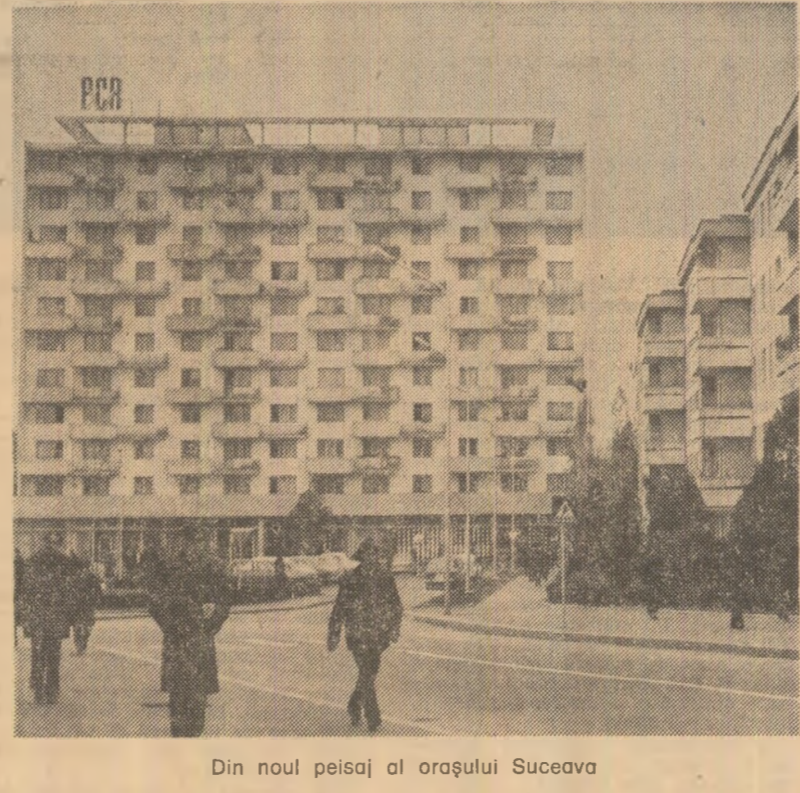
Din noul peisaj al orașului Suceava

ceștia au ajuns să se numere între oamenii de bază ai întreprinderii, între cei care se bucură de un real prestigiu în rîndurile colectivelui. Numeroși asemenea tineri au solicitat, de altfel, să fie primii în rîndurile comunistilor. „COMISIA DE DISCIPLINA MUNCITOREASCĂ“. La întreprinderea „Crisul“ din Oradea funcționează 15 asemenea comisi, în care sint cuprinși circa 100 de oameni: membri ai activității de partid, U.T.C. și sindicat, conducătorii ai locurilor de producție, muncitorii fruntași cu înaltă autoritate morală. Sfera de activitate a unei astfel de comisii este deosebit de largă: ea dezbate și analizează inițierile de la program, absentele nemotivate, nefolosirea judicioasă a timpului de lucru, încălcările disciplinei tehnologice, dar și aspecte privind conduita în familie, în societate. Comisiile așezate au fost concepute aici, ca și în alte locuri — la „Infrățirea“, de pildă — ca foruri educative, care folosesc drept metode de lucru discuția, calculul economic, munca vie de la om la om etc. urmărind ca fiecare să înțeleagă ce însemnătate a fiecărui minut, fiecare gram economisit, fiecare produs realizat la parametri calitativi superiori, măsura în care abaterile, fie ele și mărunte, de la disciplina de producție și tehnologică se răsfrîng asupra