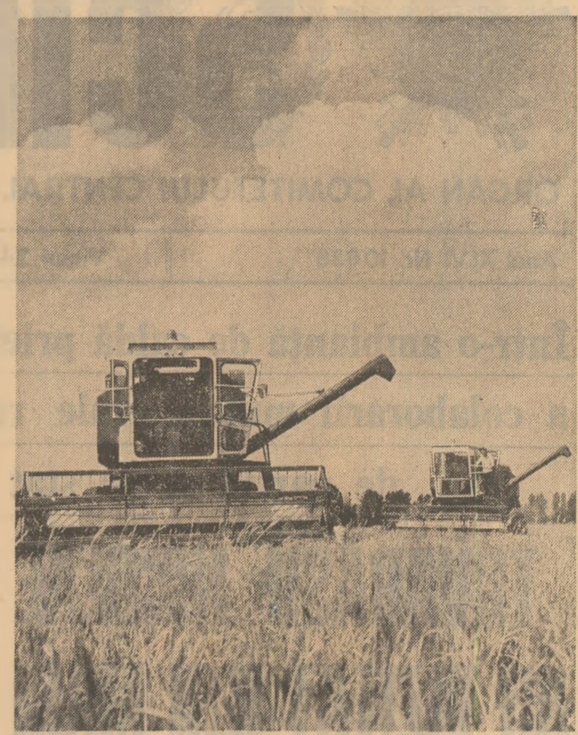
Recoltatul orzului la C.A.P. Florești-Stoenești — județul Ilfov.