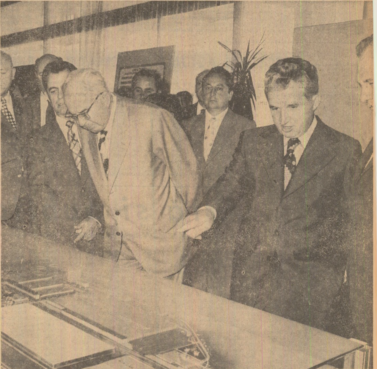
Momente din timpul vizitei la Întreprinderea de autoturisme

Dejunul s-a desfăşurat într-o atmosferă de caldă prietenie.