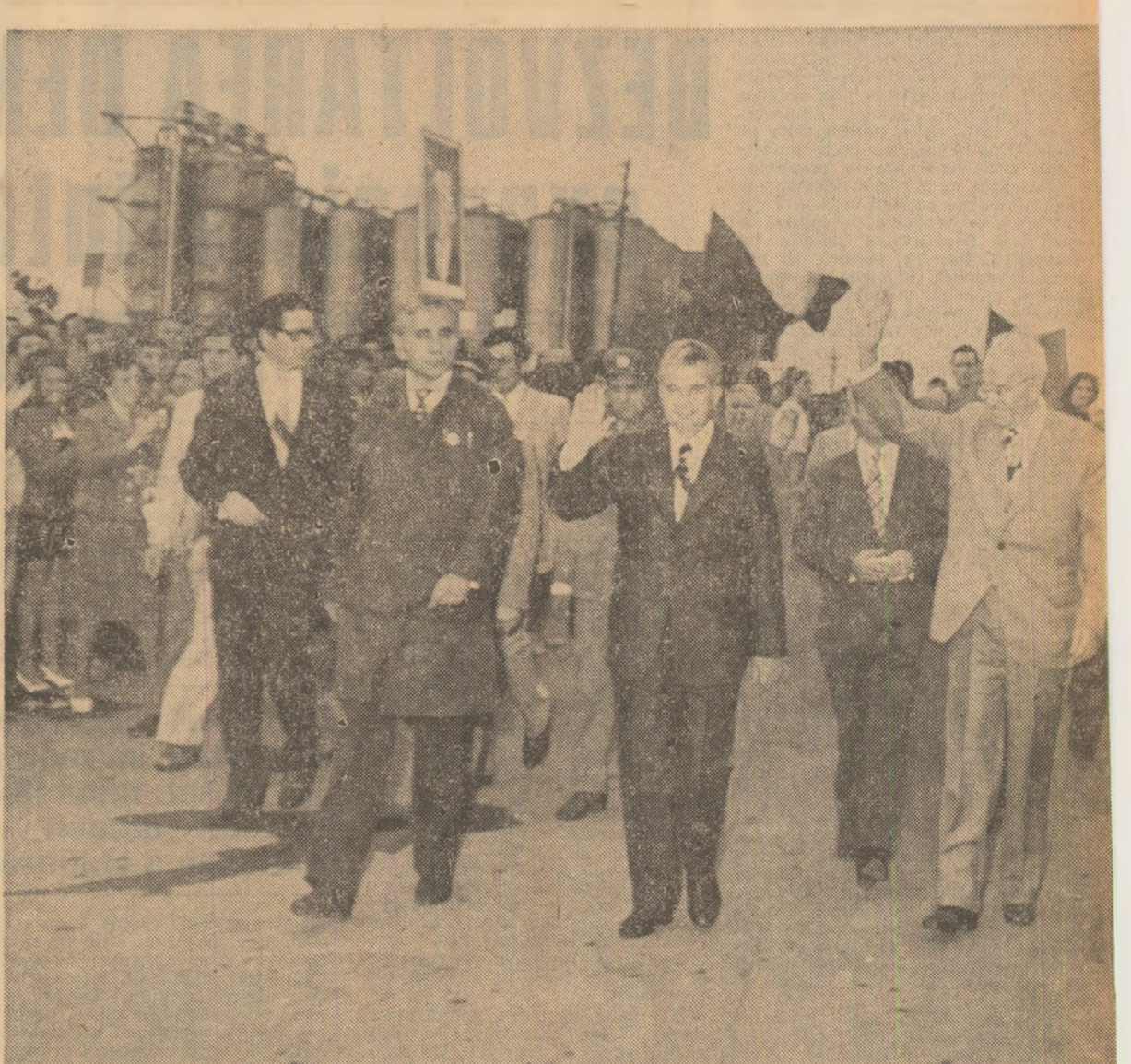
Printre petrochimiiștii piteșteni

Această atmosferă înălţătoare o regăsim şi la plecarea înalţilor oaspeţi din oraşul Piteşti. În faţa hotelului „Muntenia”, tovarăşii Nicolae Ceauşescu şi tovarăşii Gustav Husak sînt salutaţi cu puternice urale şi ovatii. Un mare ansamblu coral întonează tradiţionala urare „Multi ani trăiască”. Se scandează „Ceauşescu-Husak!” se aclamă pentru dezvoltarea prieteniei şi colaborării româno-cehoslovace. Coloana oficială străbate din nou marile bulevarde ale Piteştiului, transformate în adevărate culoare vii. Cetăţenii oraşului îşi manifestă sentimentele de aleasă stimă şi căldură printr-o ovationă îndelungă. Din maşina deschisă, tovarăşii Nicolae Ceauşescu şi tovarăşii Gustav Husak răspund cu căldură la ovatiile multimi. La înalţarea spre Capitală, coloana oficială se înscrie pe vechea şosea a Piteştiului. La trecerea prin zecile de localităţi, locuitorii, ieşii în întâmpinare cu steaguri, cu flori, salută cu entuziasm pe înalţii oaspeţi. Întreaga desfăşurare a vizitei în judeţul Argeş a constituit o nouă expresie elocventă a sentimentelor de prietenie pe care poporul român le nutreşte faţă de poporul cehoslovac, o nouă dovadă a dorinţei comune de a dezvolta în continuare, pe multiple planuri, relaţiile dintre partidele, ţările şi popoarele noastre, în folosul reciproc, al cauzei socialismului, păcii şi colaborării internaţionale.