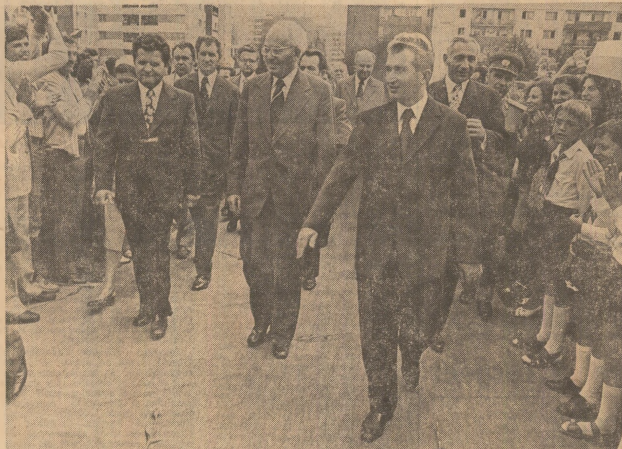
În cartierul Drumul Taberei din Capitală