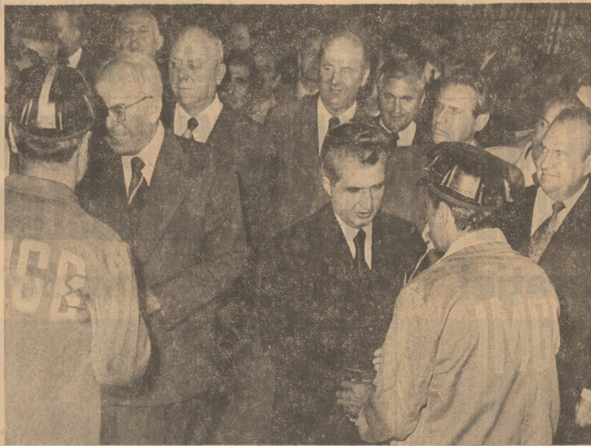
La întreprinderea de mașini grele