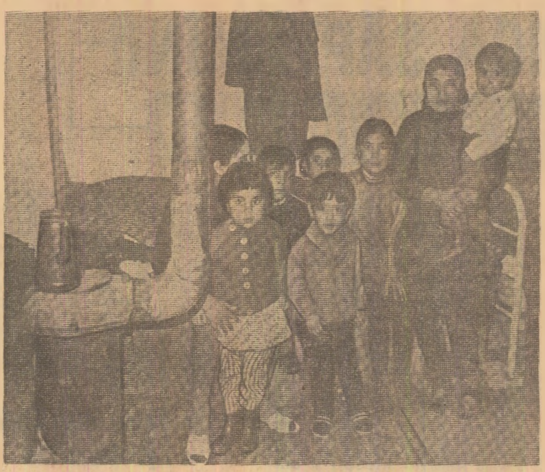
Cum arată „condiția umană” a muncitorilor imigranți