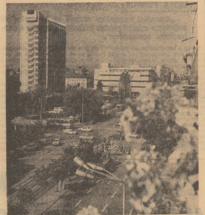
Baza turistică și de agrement aparținînd O.T.T. Timiș se dezvoltă și se modernizează continuu. Printre unitățile noi sau modernizate — ne spune tov. Ioan Grosescu, șeful oficiului, puse de curînd la dispoziția turiștilor care vizitează județul nostru, ori sînt în tranziție, se numără noul pavilion cu 48 de locuri de la motelul „Timiș”, situat la ieșirea din municipiul Timișoara, pe drumul european 94, hotelul „Dacia” din municipiul Lugoj, cantina-restaurant cu 500 de locuri din stațiunea Buzias; nobile terase din cadrul complexului „Continental” din Timișoara ș.a. La ora actuală 56 de unități de cazare stau la dispoziția turiștilor care vizitează județul. Într-o altă, dispunem de peste 1.300 locuri de cazare în modernele hoteluri și pavilioane din stațiunea balneo-climaterică Buzias și Călașea, de alte aproape 1.800 de locuri în complexe hoteliere din orașele Timișoara și Lugoj, de 203 locuri în hanuri și 218 locuri în căsuțele și cabanele de la popasurile turistice, precum și de aproape 8.000 de locuri în unitățile de alimentație publică, din care circa 3.500 locuri în grădini și terase.

De la același interlocoeur mai aflăm că lucrările de construcție a noii aripi a hotelului „Timișoara” din orașul de pe Bega au intrat în stadiul final, în luna august urmînd să fie puse astfel la dispoziția turiștilor încă 300 locuri de cazare. Tot în acest an este prevăzută darea în folosință a unui hotel balnear la Buzias, cu 284 locuri de cazare, 300 locuri de alimentație publică și 364 locuri de tratament. În contrapondere se mai află și un hotel cu 81 de locuri la Lugoj.