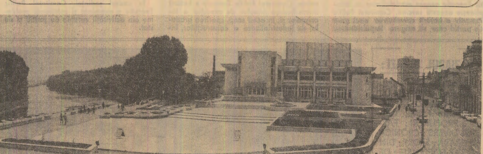
Armonii urbanistice la Lugoj