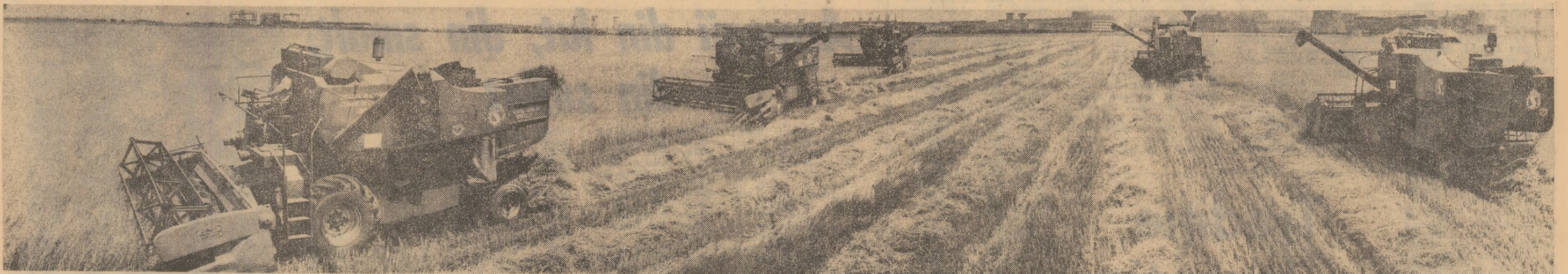
Cu o asemenea concentrare de forțe, cum este cea întîlnită în lanurile din județul Galați, recolta ajunge repede și fără pierderi în magazii