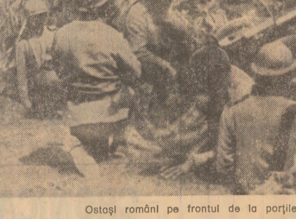
Ostași români pe frontul de la porțile Moldovei

Cooperativa de consum din județul Vrancea oferă turistilor eleva atractive locuri de popas într-o regiune de un pitoresc aparte.