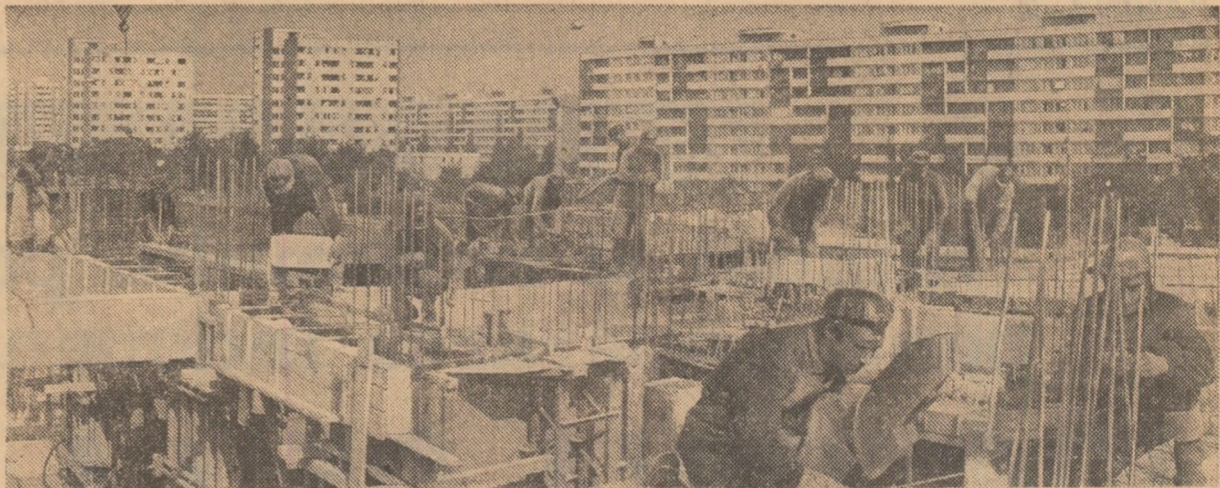
ASTAZI ESTE „ZIUA CONSTRUCTORULUI”

Pagina a III-a: „A CONSTRUI — VERB-SIMBOL, ACȚIUNE DEFINITIVĂ PENTRU REALITĂȚILE ROMÂNIEI SOCIALISTE”