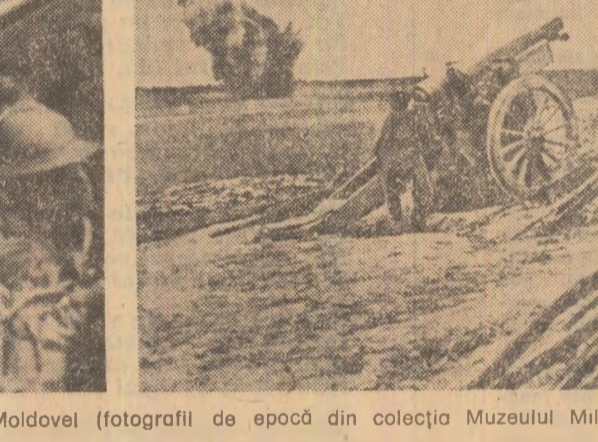
Ostași români pe frontul de la porțile Moldovei

„Apărarea frontului Mărășești, la nord de Focșani, a fost cea mai strălucită faptă de arme săvîrșită de români. Români s-au bătut cu un eroism care este mai presus de orice laudă...”