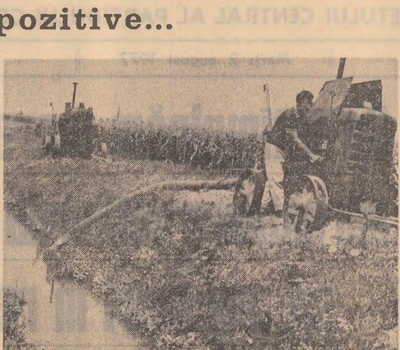
Din canalul magistral — fotografia din stînga — apa este pompată zi și noapte pe rețeaua de canale ale cooperativei agricole Gostavău, unde irigarea porumbului, sfeclii de zahăr și a culturilor duble se desfășoară neîntrerupt. La cooperativa agricolă Băbîciu — fotografia din dreapta — lanurile de porumb arată ca după ploaie. Explicația? Aici, irigațiile nu cunosc pauze. Nici ziua, nici noaptea