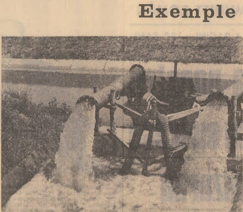
Din canalul magistral — fotografia din stînga — apa este pompată zi și noapte pe rețeaua de canale ale cooperativei agricole Gostavău, unde irigarea porumbului, sfeclii de zahăr și a culturilor duble se desfășoară neîntrerupt. La cooperativa agricolă Băbîciu — fotografia din dreapta — lanurile de porumb arată ca după ploaie. Explicația? Aici, irigațiile nu cunosc pauze. Nici ziua, nici noaptea

Se impune deci o intervenție energetică din partea comandamentului județean, a organelor agricole județene pentru a îndrepta lucrurile pe făgăsură normal, ceea ce înseamnă irigarea corespunzătoare a culturilor pe toate suprafețele planificate.