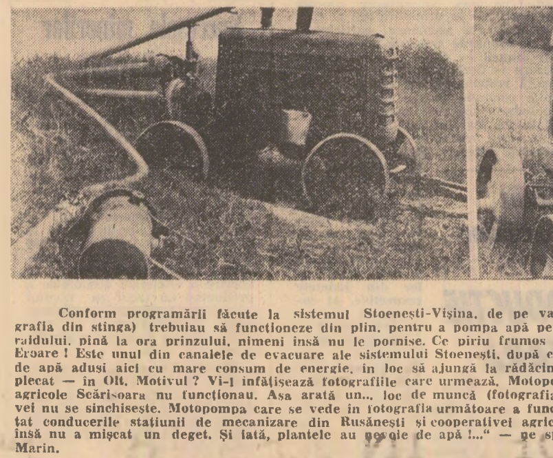
Conform programării făcute la sistemul Stoenești-Vîșina, de pe valea Oltului, cele două moto-pompe (fotografia din stînga) trebuiau să funcționeze din plin, pentru a pompa apă pe un canal de la C.A.P. Scărisoara. În ziua rădului, pînă la ora prinzului, nimeni însă nu le pornise. Ce pîru frumos — veți zice — privind fotografia a doua. Eroare! Este unul din canalele de evacuare ale sistemului Stoenești, după cum se vede din „ochi”. Mii de metri cubi de apă aduși aici cu mare consum de energie, în loc să ajungă la rădăcina plantelor însetate, se întorc de unde au plecat — în Olt. Motivul? Vi-i înfățișează fotografiile care urmează. Moto-pompele amplasate pe canalele cooperativei agricole Scărisoara nu funcționau. Așa arată un... loc de muncă (fotografia 3), și nimeni din conducerea cooperativei nu se sinchisește. Moto-pompa care se vede în fotografia următoare a funcționat pînă acum doar 15 zile. „Am anunțat conducerea stațiilor de mecanizare din Rușnăși și cooperativei agricole Scărisoara că s-a defectat. Nimeni însă nu a mișcat un deget. Și iată, planetele au găsit o cale...” — ne spune cu năduf mecanicul Vasile Florea Marin.