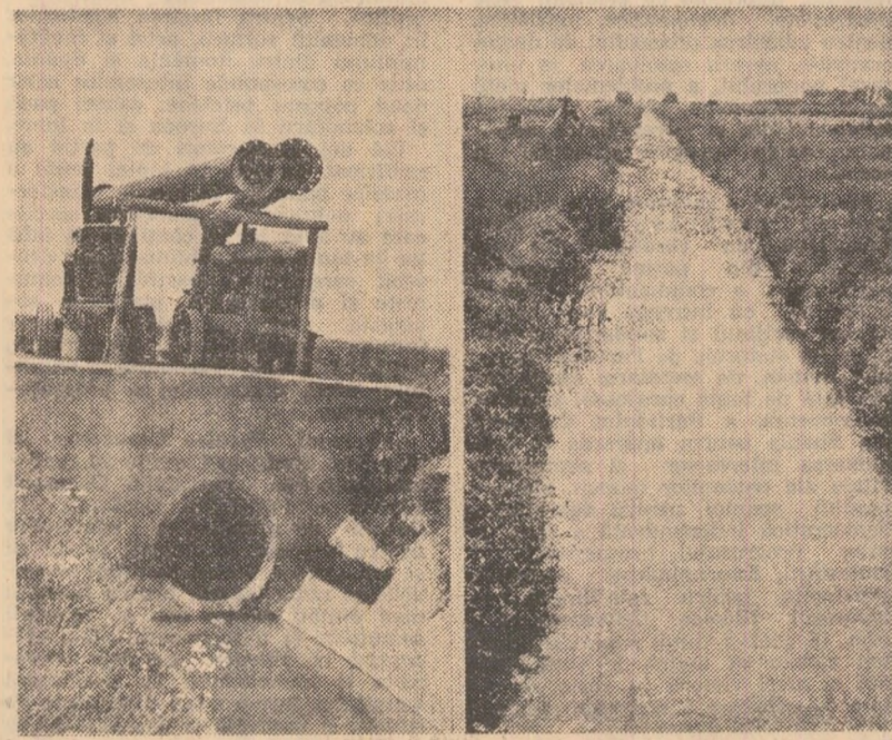
Conform programării făcute la sistemul Stoenești-Vîșina, de pe valea Oltului, cele două moto-pompe (fotografia din stînga) trebuiau să funcționeze din plin, pentru a pompa apă pe un canal de la C.A.P. Scărisoara. În ziua rădului, pînă la ora prinzului, nimeni însă nu le pornise. Ce pîru frumos — veți zice — privind fotografia a doua. Eroare! Este unul din canalele de evacuare ale sistemului Stoenești, după cum se vede din „ochi”. Mii de metri cubi de apă aduși aici cu mare consum de energie, în loc să ajungă la rădăcina plantelor însetate, se întorc de unde au plecat — în Olt. Motivul? Vi-i înfățișează fotografiile care urmează. Moto-pompele amplasate pe canalele cooperativei agricole Scărisoara nu funcționau. Așa arată un... loc de muncă (fotografia 3), și nimeni din conducerea cooperativei nu se sinchisește. Moto-pompa care se vede în fotografia următoare a funcționat pînă acum doar 15 zile. „Am anunțat conducerea stațiilor de mecanizare din Rușnăși și cooperativei agricole Scărisoara că s-a defectat. Nimeni însă nu a mișcat un deget. Și iată, planetele au găsit o cale...” — ne spune cu năduf mecanicul Vasile Florea Marin.