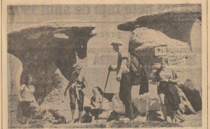
„Babele” din Bucegi, loc de popos al unor excursii pornind din Sînzolă