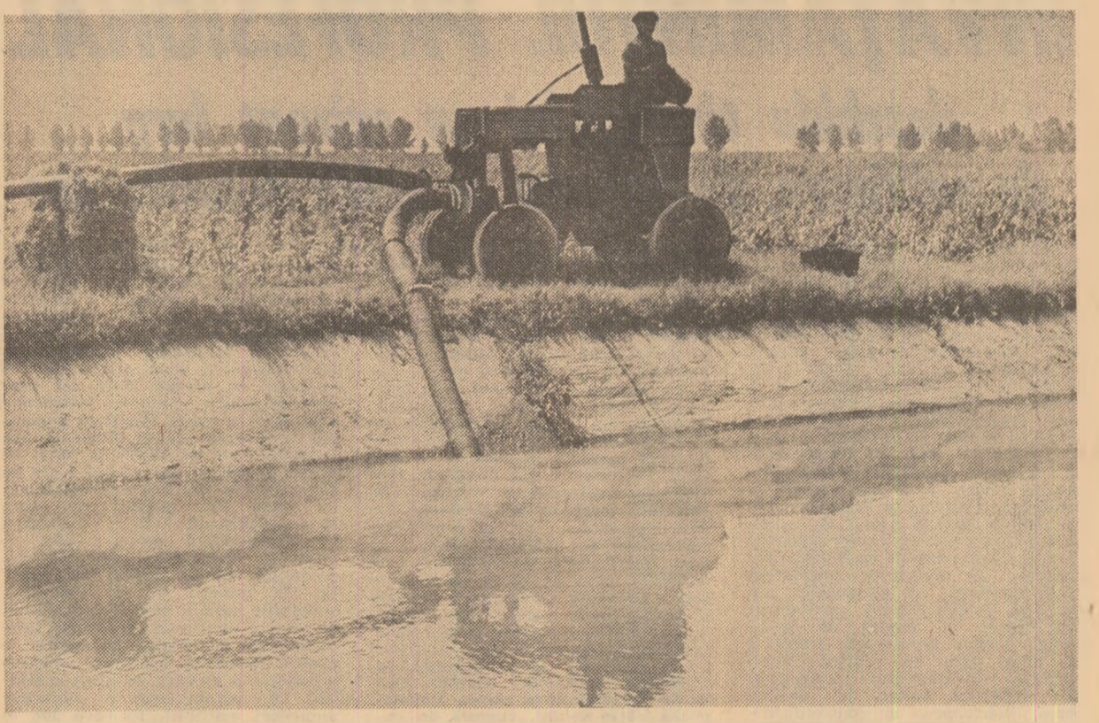
Apă, cit mai multă apă pentru culturii! Imagine de la C.A.P. Cuza Vodă (județul Ialomița)