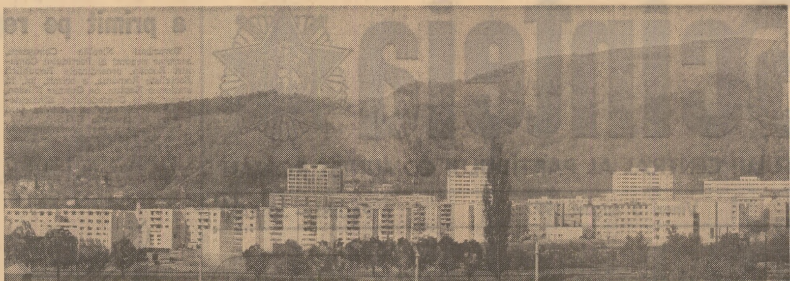
— În stînga, a văzut un autocar O.N.T. (34-B-81) care abia aducea în Aiud un grup de elevi. Atunci — nitam, nitam — M.F. îl întreba pe autocar: „Ce mai faci, fratele meu?”. Si, nici una, nici alta, l-a și luat de... oțan. Cum, acum, pînă la urmă M.F. a renunțat la excursie, iar autocarul, accidentat, a fost abandonat pe șoseaua Alba Iulia — Sebeș, după 30 km de drum.

Nu e greu de imaginat ce schimbări fundamentale a avut orașul, a avut în viața oamenilor fanful că majoritatea cetățenilor locuiesc astăzi în case noi. Ritmul în care s-a construit aici — ca de altfel pretutindeni în țară — a avut ca rezultat nu numai creșterea nivelului de trai, ci și asigurarea, în același