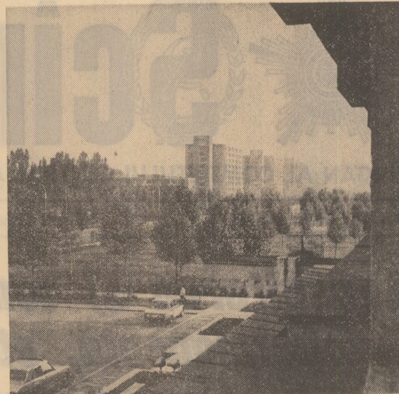
Ilustrat din Hunedoara