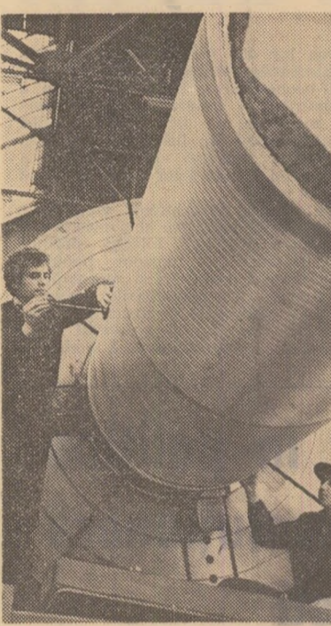
Întreprinderea de utilaj chimic „Grivița roșie” din Capitală — secția de prelucrări mecanice

Nu există județ din care nu s-ar putea cita numeroase exemple concludente despre preocuparea pentru fructificarea valentelor stilului de muncă propriu partidului nostru — stil dinamic, concret și eficient — despre munca generoasă, plină de dăruire și responsabilitate comunistă a atitor activiști de partid. Acționând cu abnegație și devotament pentru aplicarea în viața a politicii partidului pentru mobilizarea ener-