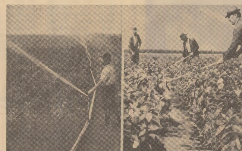
Prin aspersiune pe terenurile fermei nr. 2 Afumați a I.P.I.L.F. (prima fotografie) și pe brazde în grădina cooperativei agricole din Sinești (fotografia 2-a), S-ar putea iriga mai mult. Dar în timp ce motopompele cooperativei agricole din Sinești funcționează din plin (fotografia 3-a), alături, la numai cîțiva metri, stația de pompare a fermei nr. 4 — I.P.I.L.F. stă din lipsă de curent electric (fotografia nr. 4)