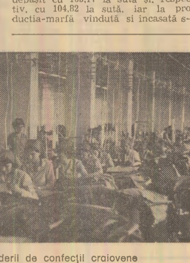
Una din secțiile întreprinderii de confecții craiovene

înregistrat o depășire de 121,99 la sută; s-au obținut economii la prețul de cost de 4,5 milioane lei, cu 200 000 lei mai mult față de preve-deri; de asemenea, planul la expo-rtați a fost depășit simțitor.