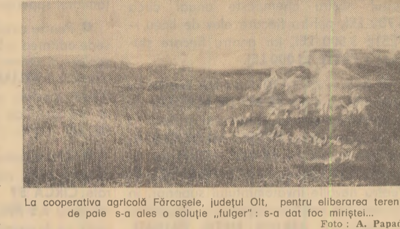
La cooperativa agricolă Fărcașele, județul Olt, pentru eliberarea terenului de paie s-a ales o soluție „fulger”: s-a dat foc miștelor...

În același timp, și constructorii au o serie de cerințe îndreptățite față de factorii cu care colaborează pe platfor-ma de investiții a orașului Tulcea, dintre care cea mai importantă este necesitatea asigurării unui flux rit-mic, nentrerupt al aprovizionării cu materiale de construcții, în special ciment și agregate. Tot la acest ca-pitol, consensăm apelul comuniștilor și muncitorilor de la Trustul de construcții industriale Constanta a pri-dreșat întreprinderilor „Granit” din București (de a livra cu prioritate tuburile pentru executarea lar-crărilor de canalizare), „Napochim” din Cluj-Napoca și I.F.E.T. din Miercurea-Ciuc (de a livra elemen-tele componente ale noilor tipuri de luminatoare necesare la hala de completare-armare).