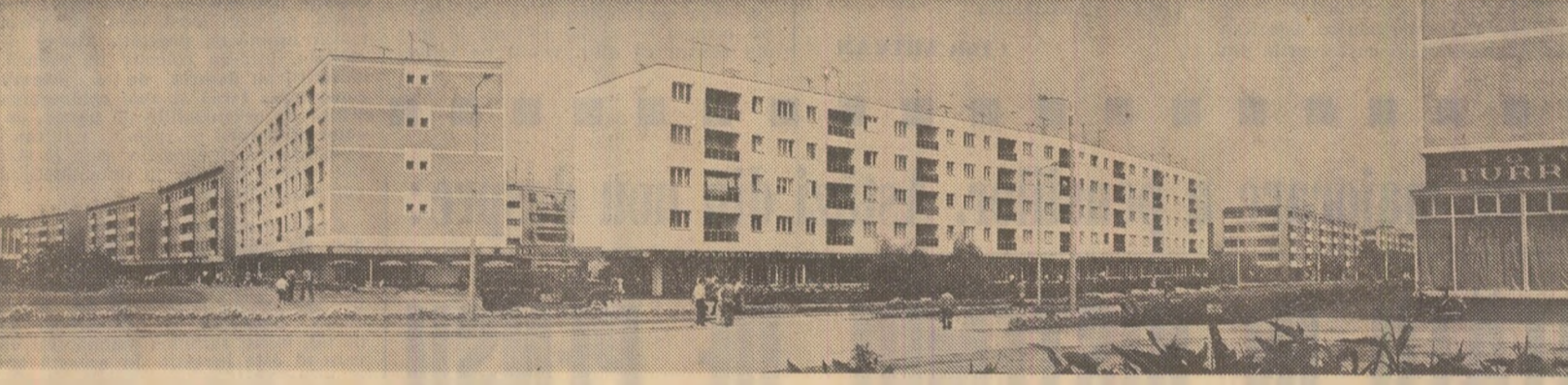
Noi construcții într-un străvechi oraș — Turnu Măgurele

Joi dimineață, la termocentrala Ișalnița a fost produs cel de-al 58-lea miliard kilowatt/oră energie electrică de la conectarea la sistemul energetic a primului agregat al unității.