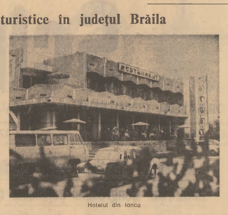
Hotelul din Ianca

...Nu mă ațrăge... bino m-as face mecanic la fabrica de serviz și altceva... Luna asta chiar am de zînd să plec. La Timisoara. Am o mîșcă acolo... — Ne-am uitat prin sală. În speranța că vom descoperi și prezenta vreunul reprezentant al I.O.R. Nu era. Am încercat să aflăm de la deza toate garanțiile de primire vreau anul de la întreprindere, dacă cineva se interesa de soarta tinărului cu pricina. Nișnău. După spusele acestuia, nici această nu-l căutașe cineva să-l întreb de ce nu vine la lucru, desi abundența se înnulțiseră.