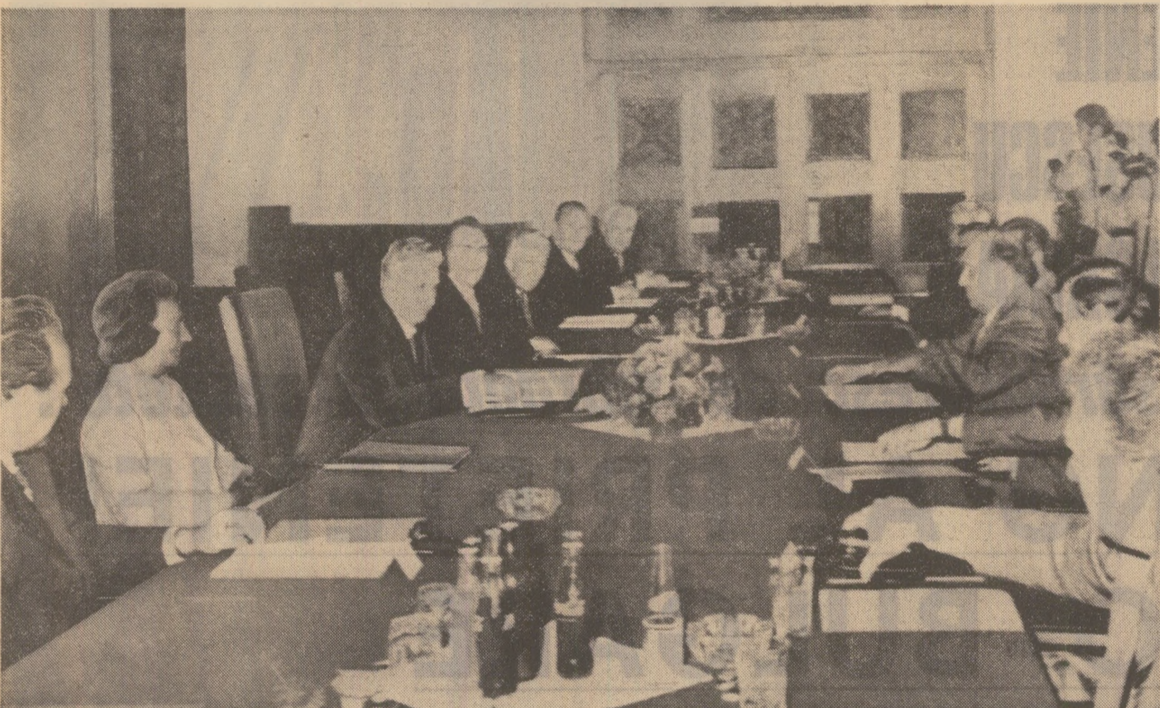
Moment însuflețit înaintea începerii convorbirilor oficiale