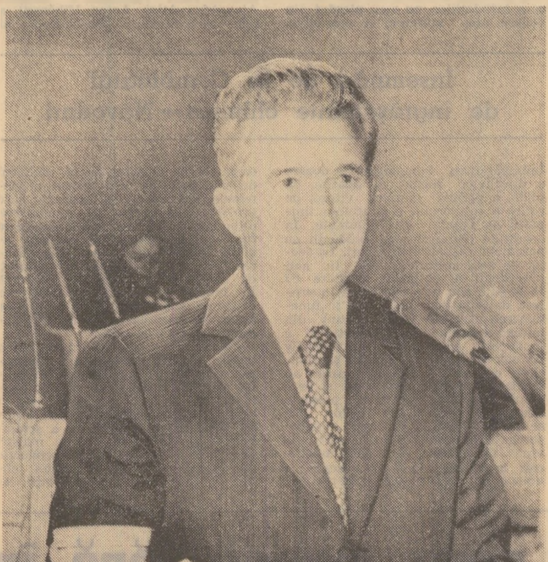
Nicolae Ceaușescu, șeful delegației române, în discuții cu tovarășii săi bulgari, în timpul vizitei sale în Bulgaria.

Dezvoltăm, de asemenea, larg raporturile de colaborare și solidaritate cu toate statele care și-au dobîndit independența și dăsc pe calea progresului de sine stătătoare, cu țările în curs de dezvoltare, cu statele nealiniate. Dezvoltăm, de asemenea, larg raporturile de colaborare și solidaritate cu țările capitaliste dezvoltate, cu toate statele lumii, fără deosebire de orînduire socială. România acționează ferm pentru înfrîntarea securității și colaborării pe continent, pentru transparența viații a documentelor semnate la Conferința general-europeană de la Helsinki. Acordăm o mare importanță acțiunilor de la Belgrad, din toamna acestui an, de care așteptăm impulsivitatea activității de în-