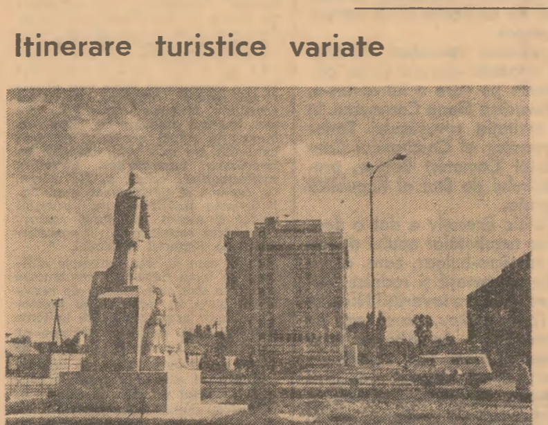
In fotografie: hotelul „Pietroasele” din Buzău

am creat condiții mai bune de tratament și răzduirii în stațiunile de odihnă din județul nostru. Numolul sanepidologic existent aici are o mare eficiență în ameliorarea afecțiunilor reumatice”. (Mihai Băzu). În fotografie: hotelul „Pietroasele” din Buzău