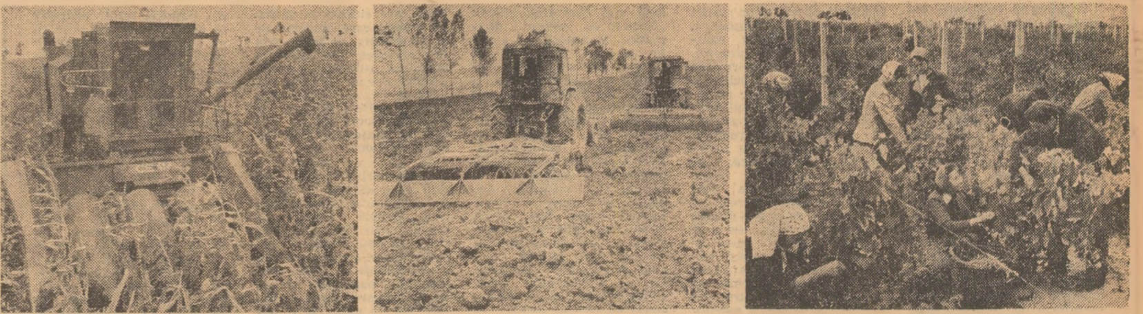
În județul Galați, lucrările agricole de toamnă continuă cu intensitate...