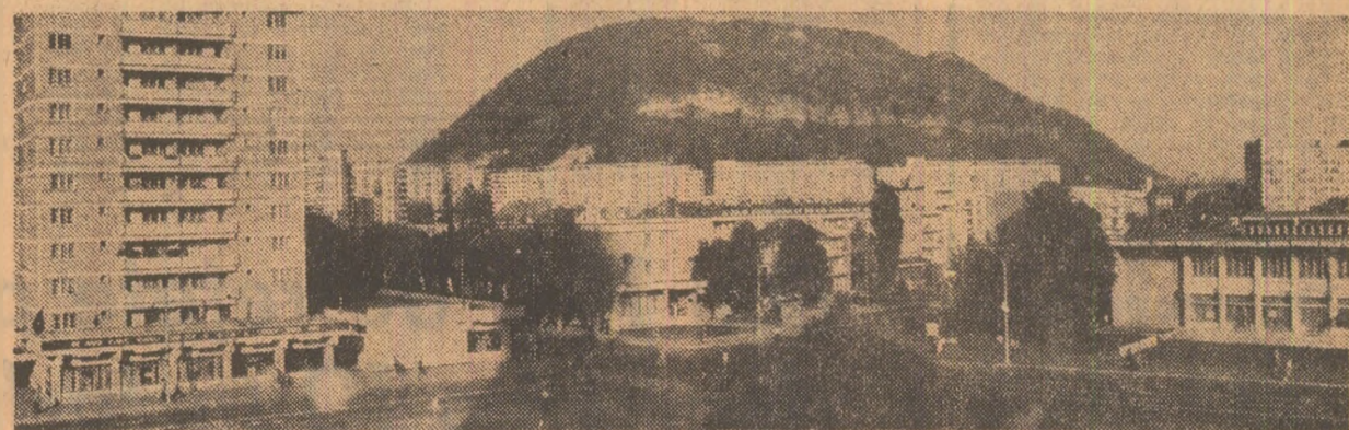
Din noua urbanistică a orașului Piatra Neamț