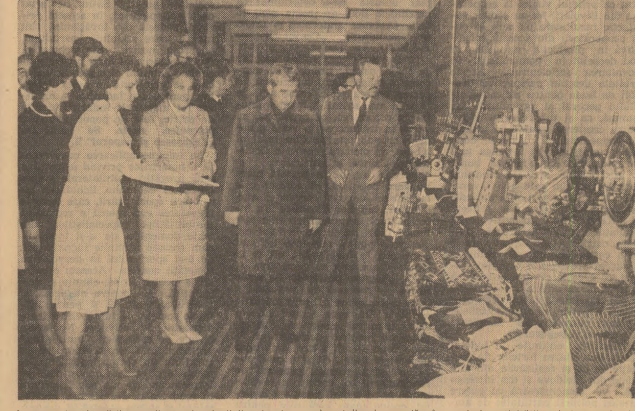
La expoziția lucrărilor realizate de elevii liceelor ieșene în atelierele-școli, în cadrul activității tehnico-productive