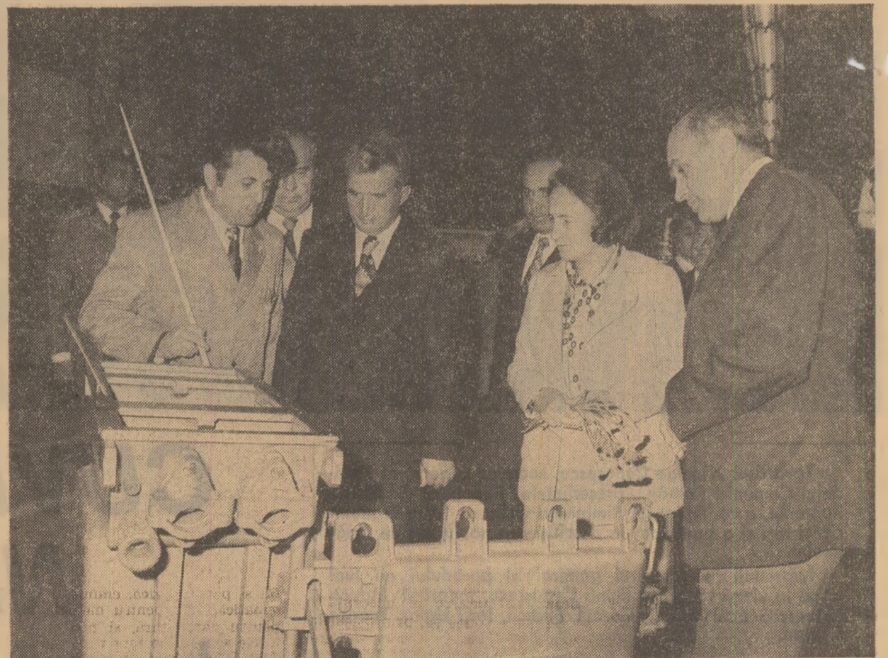
La întreprinderea „Electrocontact” de pe marea platformă industrială a Botoșanilor

(Toți participanții la marea adunare populară din Botoșani aplaudă și scandează îndelung, ovacionînd pentru Partidul Comunist Român și secretarul general al partidului, tovarășul Nicolae Ceaușescu, exprimîndu-și voința fermă de a face totul pentru transpunerea în viață a hotărîrilor Congresului al XI-lea, a indicațiilor tovarășului Nicolae Ceaușescu, pentru progresul și prosperitatea întregii noastre țări).