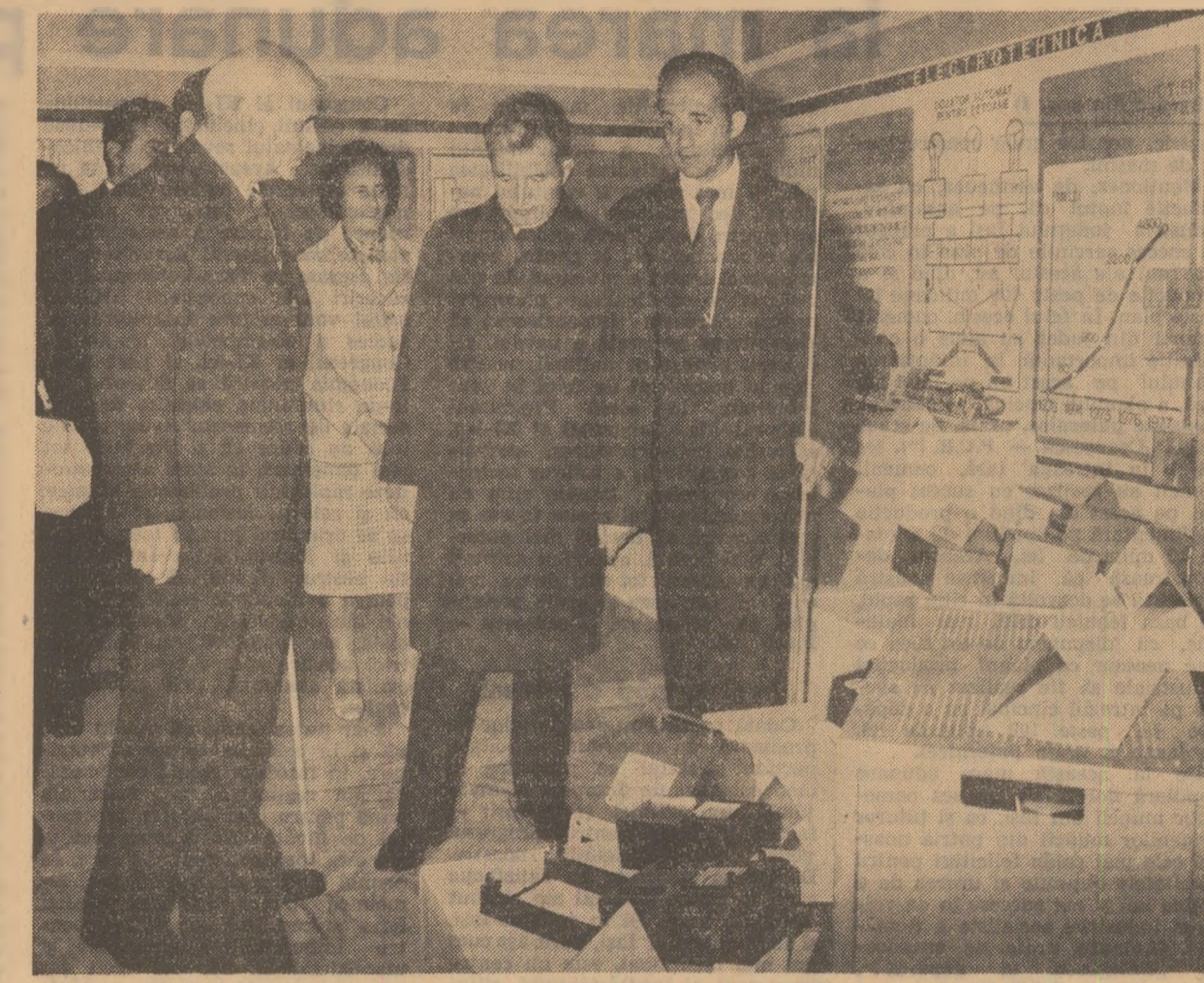
La Institutul politehnic

La plecarea din Iași spre Botoșani, tovarășul Nicolae Ceaușescu și tovarășa Elena Ceaușescu, ceilalți tovarăși din conducerea de partid și de stat au fost salutați cu aceeași căldură și însuflețire cu care au fost întâmpinați pe toată durata vizitei. Localnicii au ovacionat îndelung de secretarul general al partidului, exprimîndu-și satisfacția de a-l fi avut din nou oaspete drag în mijlocul lor și l-au urat din inimă multă sănătate și putere de muncă, spre binele și fericirea națiunii noastre.