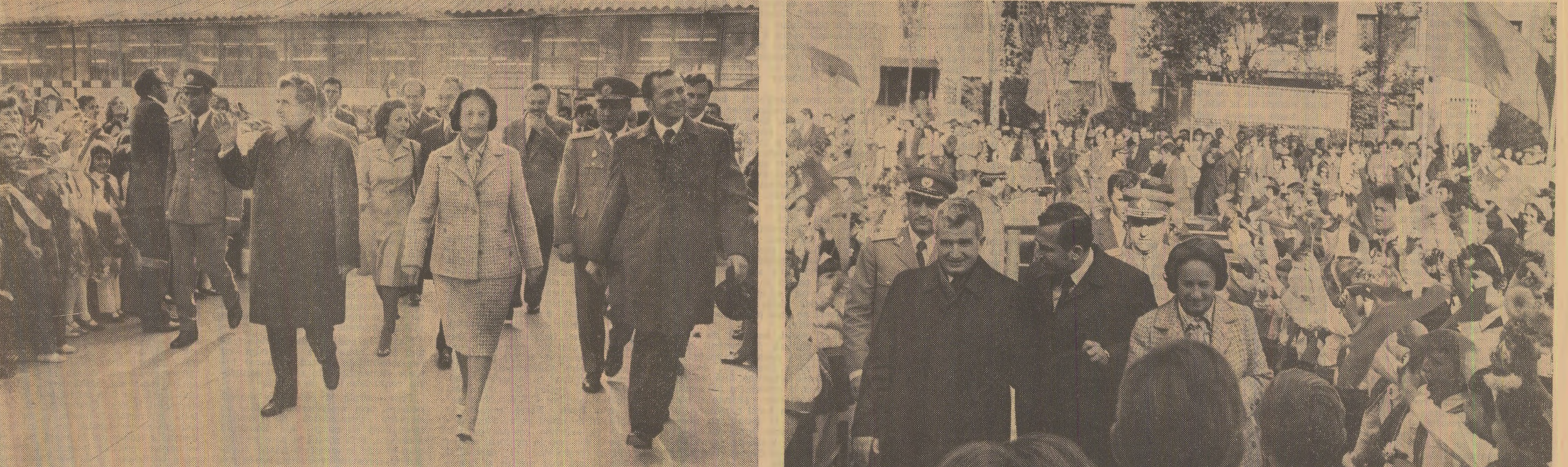
Flori și ovăși din partea copiilor și tineretului studios al patriei, la început de an școlar, pentru secretarul general al partidului, în semn de recunoștință pentru minunatele condiții de viață și învățatură, de pregătire temeinică în vederea unui viitor de muncă, de înfăpturi și bucurii

Cu acestea vă urez, dragi tovarăși și prieteni, tuturor, succese tot mai mari în întreaga activitate, multă sănătate, fericire și bucurie! (Participanții la marea adunare populară au aplaudat și ovacionat minute în sir scîndînd „Ceaulescu și poporul”, manifestînd pentru Partidul Comunist Român, pentru secretarul general al partidului, exprimîndu-și hotărîrea de a face totul pentru transpunerea în viață a hotărîrilor Congresului al XI-lea, pentru înflorirea continuă a patriei noastre socialiste).