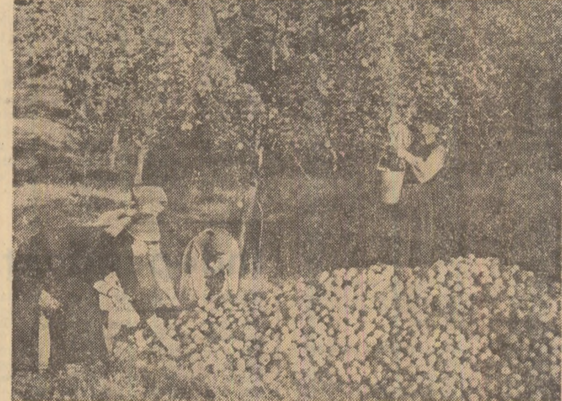
Utilaje de mare capacitate utilizate la recoltarea sfeclei de zahăr, pe ogarele C.A.P. Balaciu, județul Ialomița (fotografia din stînga). În sprijinul cooperativeilor industriale din Orașul Victoria, pentru a grăbi culesul cartofilor (fotografia din mijloc). În livezile cooperativei agricole Topoloveni, județul Argeș, recoltarea beneficiarilor (fotografia din dreapta)

Colectivului Combinatului de Lăni și azbociment din Fieni i-a revenit, în acest an, cîntea de a chema la întrecere unitățile din ramura industriei materialelor de construcții. Angajamentul — ambiciu prin obiectivele stabilite — trebuia să conducă la fabricarea exemplară a rezervorilor existente în domeniul producției și eficienței economice, la finalizarea în bune condiții a lucrărilor de investiții aflate în execuție. Ce prevedea angajamentul asumat?